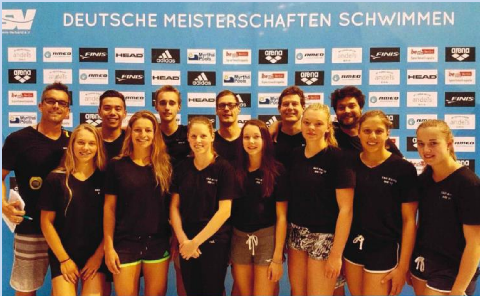
Die 1. Mannschaft der SSG Reutlingen/Tübingen bei den Deutschen Meisterschaften Schwimmen 2017