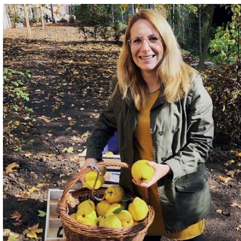
Liquid Family