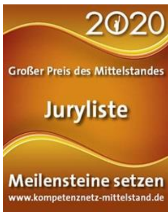
Bild: Großer Preis des Mittelstandes