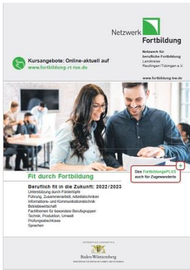
Grafik: Netzwerk Fortbildung