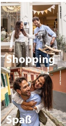
Bild: Ausschnitt der Anzeige

Im Rahmen einer Awareness-Kampagne für den Tübinger Einzelhandel und die Gastronomie hat die WIT eine Anzeige im Magazin „Mein Ländle“ geschaltet, in der auf das Thema Einkaufen in Tübingen an einem Markttag aufmerksam gemacht wird. Im redaktionellen Teil derselben Ausgabe wird der Neckartalradweg vorgestellt. Das Heft hat eine Auflage von 56.000 Exemplaren und erreicht mehr als 150.000 Leser_innen in Baden-Württemberg. https://www.mein-laendle.de/