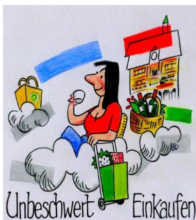
Bild: Unbeschwert einkaufen

Anlässlich des „Sustainable Gastronomy Day“ am 18. Juni rief der Mehrweg-Systemanbieter RECUP den Nachhaltigkeitsmonat aus: Alle Gastronomiebetriebe, die bis zum 17. Juli eine RECUP/REBOWL-Partnerschaft für mindestens zwölf Monate abschließen, können RECUP und REBOWL bis Ende des Jahres kostenlos nutzen! Zahlreiche Tübinger Betriebe machen bereits mit. https://recup.de/kostenlos-nutzen