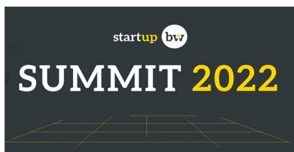
Bild: Start-up BW Summit 2022