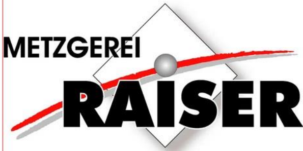
Logo: Metzgerei Raiser