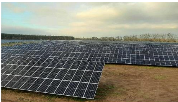
Solarpark "Metzdorf II"