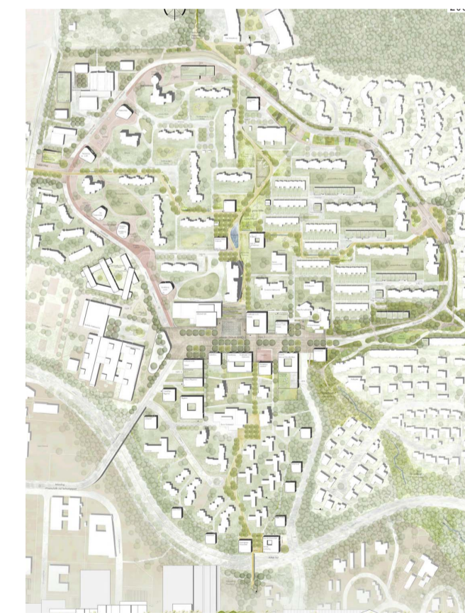
3. Preis Hähmig Gemmeke Architekten BDA, Tübingen

Klar ist auch, dass der Entwurf eine Grundlage darstellt, auf der aufbauend im kommenden Jahr noch der Rahmenplan für WHO entwickelt werden muss. Der Plan wird also nicht so, eins zu eins, gebaut. Gebäude auf privaten Freiflächen von WEGs sind als Angebot zu verstehen. Es gibt keinerlei Verpflichtung dort zu bauen. In einem Dialog mit den Bewohnerinnen und Bewohnern, sowie Akteuren auf WHO, möchten wir den Entwurf nun gemeinsam mit dem Büro Machleidt weiter ausformulieren.