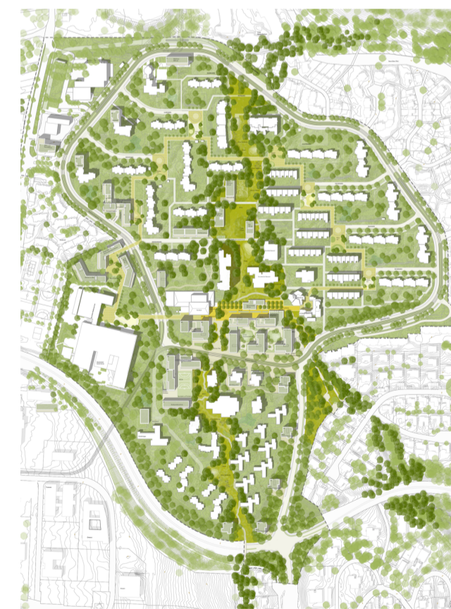
2. Preis ArGE Planetz mit OK Landschaft, München

Mit der Sonderform in der Stadtmitteln wird bewusst ein Kontrast gesetzt. Eine Verschmälerung des Berliner Rings trägt zu einem fußgänger- und radfahrerfreundlichen Stadtteil bei. Vom zentralen Bereich Richtung Norden entsteht eine Abfolge an öffentlichen Freiräumen in Verbindung mit besonderen Nutzungen. Gut überlegte bauliche Setzungen im westlichen Teil gehen respektvoll mit dem Bestand um und schaffen doch neue Impulse für den Stadtteil. So entstehen durch einzelne bauliche Ergänzungen neue Wohnhöfe, die die bestehende bauliche Struktur weiterentwickeln und Nachbarschaften bilden. Am östlichen Rand des Studierendendorfs sollen weitere Gebäude den Stadteingang stärken, zusätzliche Hochpunkte entlang des westlichen Berliner Rings tragen zur Adressbildung bei. In der Mitte des Stadtteils entsteht ein neuer Ort der Generationen mit sozialen Einrichtungen