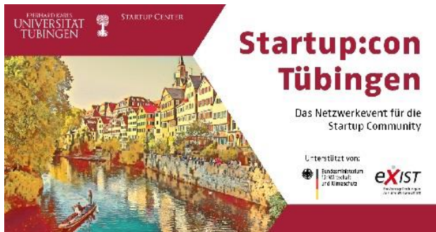
Grafik: Universität Tübingen