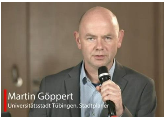
Screenshot: Universitätsstadt Tübingen