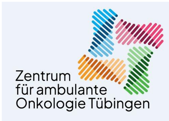
Logo: MVZ Zentrum für ambulante Onkologie GmbH