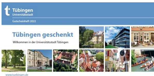
Cover Gutscheineft: WIT