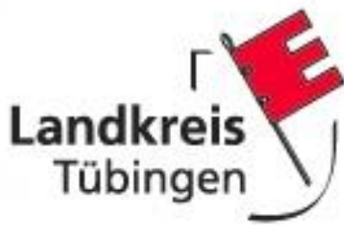
Logo: Landkreis Tübingen