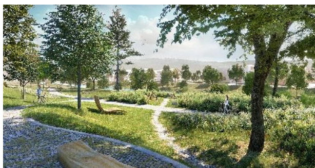
Koeber Landschaftsarchitektur GmbH

In derselben Sitzung votierte der Gemeinderat mit deutlicher Mehrheit, jedoch mit 13 Gegenstimmen, für die dauerhafte Sperrung der Mühlstraße für Autos. Ausgenommen von der Sperrung sind Busse, Taxis und der Lieferverkehr. Für den Radverkehr soll eine Abbiegemöglichkeit von der Mühlstraße in die Gartenstraße eingerichtet werden. Der bestehende Radstreifen auf der Neckarbrücke und vorderen Wilhelmstraße soll auch bleiben. https://www.tuebingen.de/gemeinderat/vo0050.php?kvonr=16916