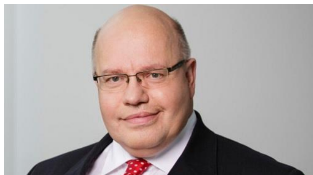
Bundeswirtschaftsminister Peter Altmaier