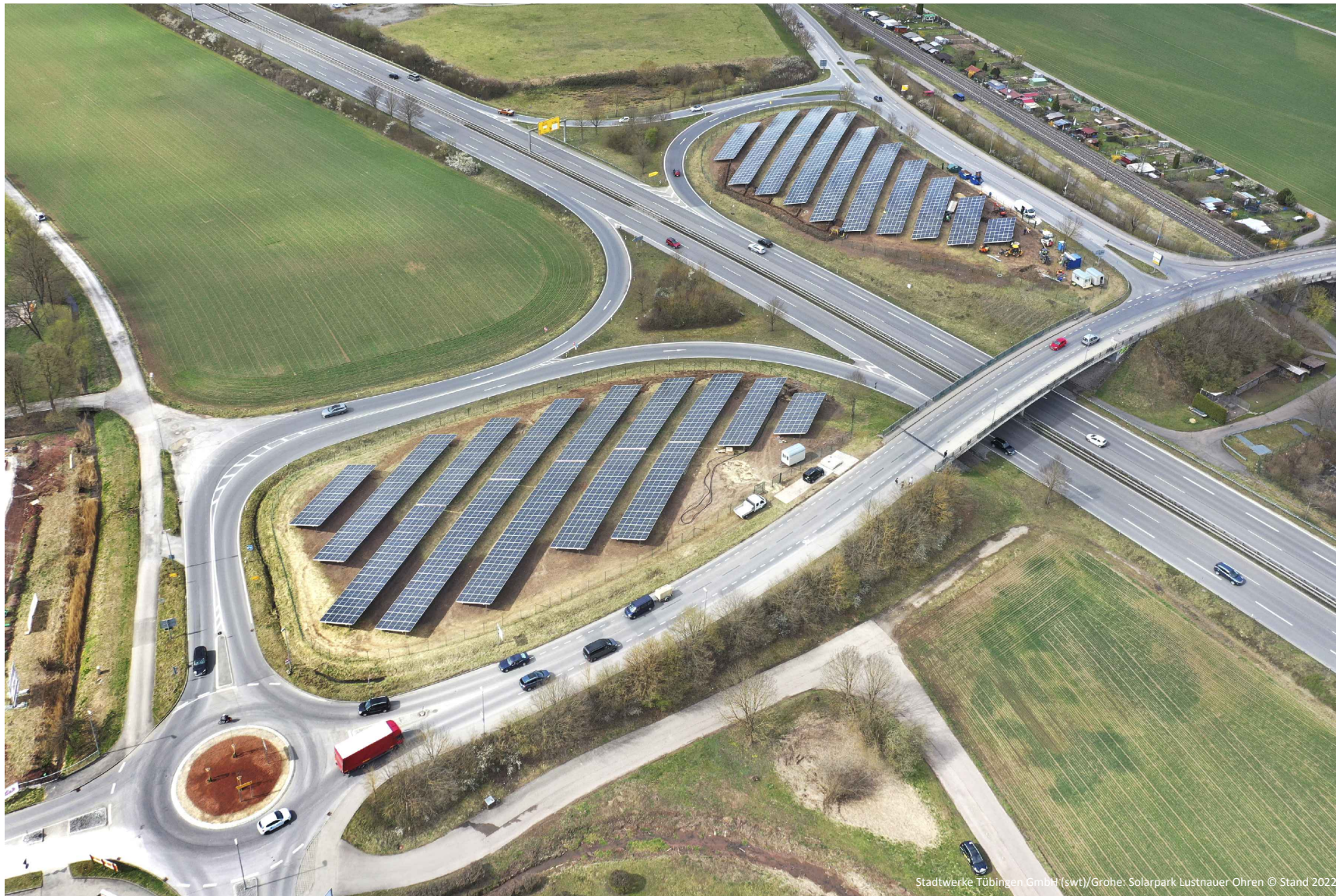
Stadtwerke Tübingen GmbH (swt)/Grohe: Solarpark Lustnauer Ohren © Stand 2022