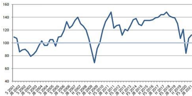
Grafik: IHK Reutlingen

Nachdem sich die konjunkturelle Situation in der Region Neckar-Alb im vergangenen Herbst etwas beruhigt hatte, zeigt die Tendenz weiter nach oben: Der von der IHK Reutlingen veröffentlichte Konjunkturklimaindex war aufgrund des Coronaschocks letzten Sommer so stark wie selten zuvor eingebrochen, konnte sich jedoch im Herbst wieder fangen und legte zu Jahresbeginn erneut zu, diesmal um fünf Punkte. Der Index kommt auf einen Wert von 112 Punkten und bleibt damit über der 100-Punkte-Marke. https://www.reutlingen.ihk.de/