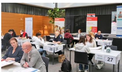
Bild: Azubi- Speeddating

Und zum Schluss noch eine Terminankündigung: Das dritte Tübinger Azubi-Speeddating findet am 26. April 2023 statt. Damit unterstützt die WIT Unternehmen, die auf der Suche nach passenden Nachwuchskräften aus der Region sind. http://www.azubi-speed.de/