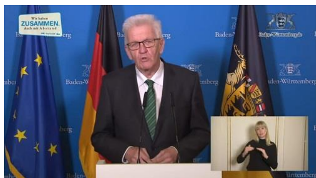
Ministerpräsident Kretschmann