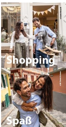
Bild: Ausschnitt der Anzeige