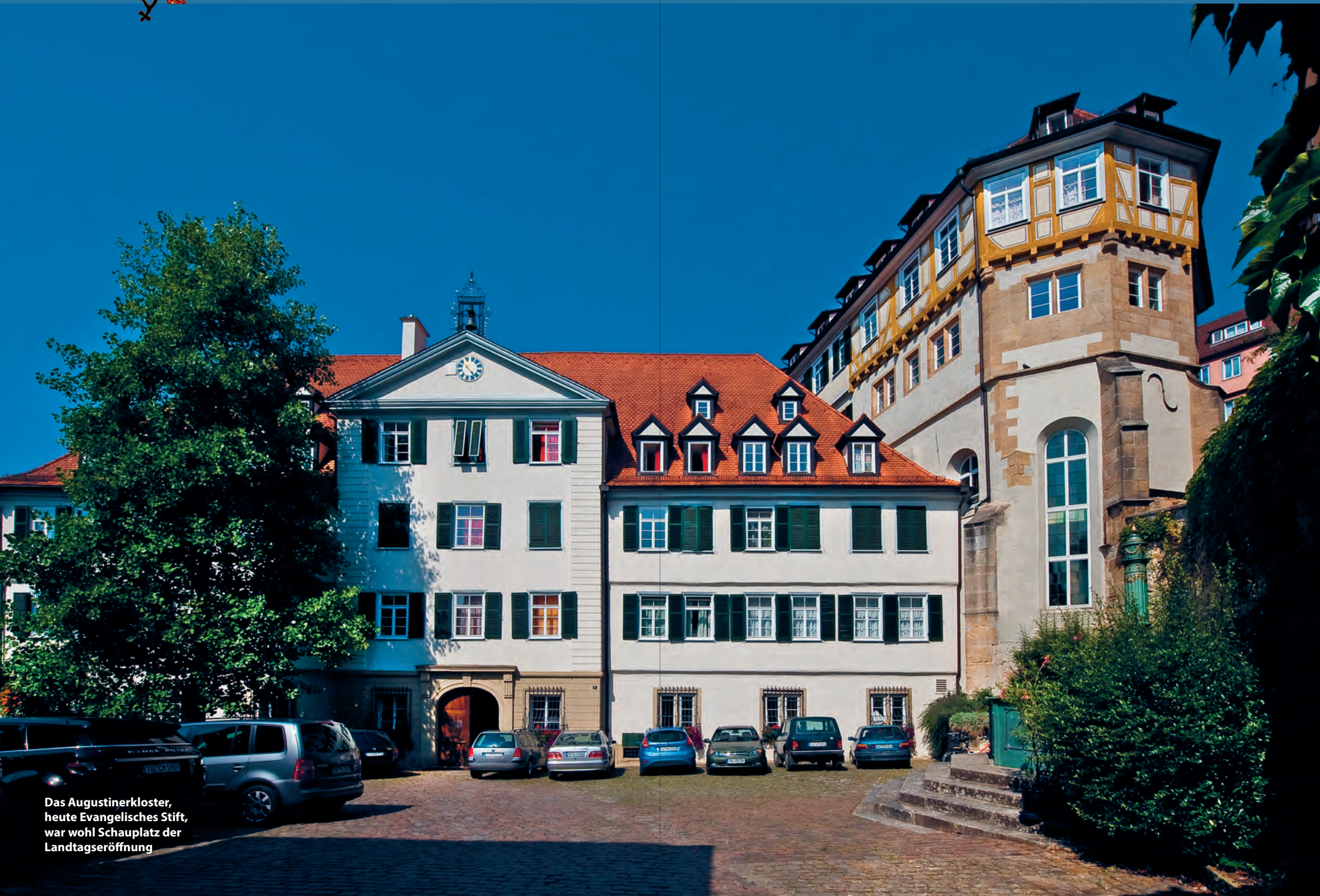
Das Augustinerkloster, heute Evangelisches Stift, war wohl Schauplatz der Landtagseröffnung