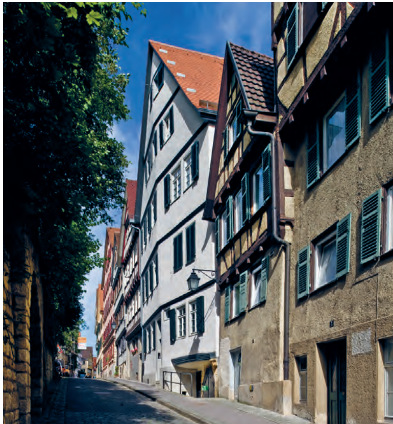
Neckarhalde 13, Druckerei des Thomas Anshelm

Thomas Anshelm war von 1511 bis 1516 in Tübingen tätig. Mit ihm begann „eine erste Glanzzeit des Buchdrucks“ in der Universitätsstadt. Der junge Philipp Melanchthon hat als Korrektor für ihn gearbeitet. Gut vorstellbar, dass auch der Tübinger Vertrag durch seine Hände gegangen ist.