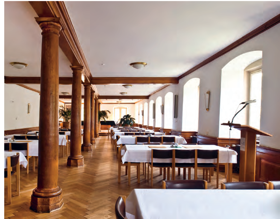
Speisesaal des Evangelischen Stifts

Sehr wahrscheinlich wurde der Tübinger Landtag am 26. Juni 1514 im Augustinerkloster eröffnet. So war es jedenfalls im Jahr 1525 – elf Jahre später – als die Ständeversammlung wegen des Bauernkriegs erneut in Tübingen tagte. Das Augustinerkloster war sicherlich für alle Teilnehmer ein geschätzter neutraler Ort. Außerdem gab es hier geeignete Räumlichkeiten – zum einen in der 1413 erneuerten Augustinerkirche (Inscription außen am Chor) und im großen Hörsaal des Südflügels, der sonst von den Theologen der Universität benutzt wurde.