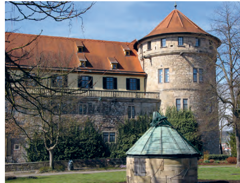
Schloss Hohentübingen, Machtzentrum des Herzogs

Als Dank für die Mithilfe bei der Niederschlagung des Armen Konrad erhielt die Stadt Tübingen u.a. drei „Feldschlangen“. Das waren Kanonen, die seitdem auf dem Schloss Hohentübingen aufgestellt waren. Die drei alten Kanonen mussten zu Beginn des 19. Jahrhundert abgegeben werden, wurden allerdings schon 1812 durch neue ersetzt. Eine davon hat sich erhalten und wurde im Juni 2010 wieder im Schlosshof aufgestellt.