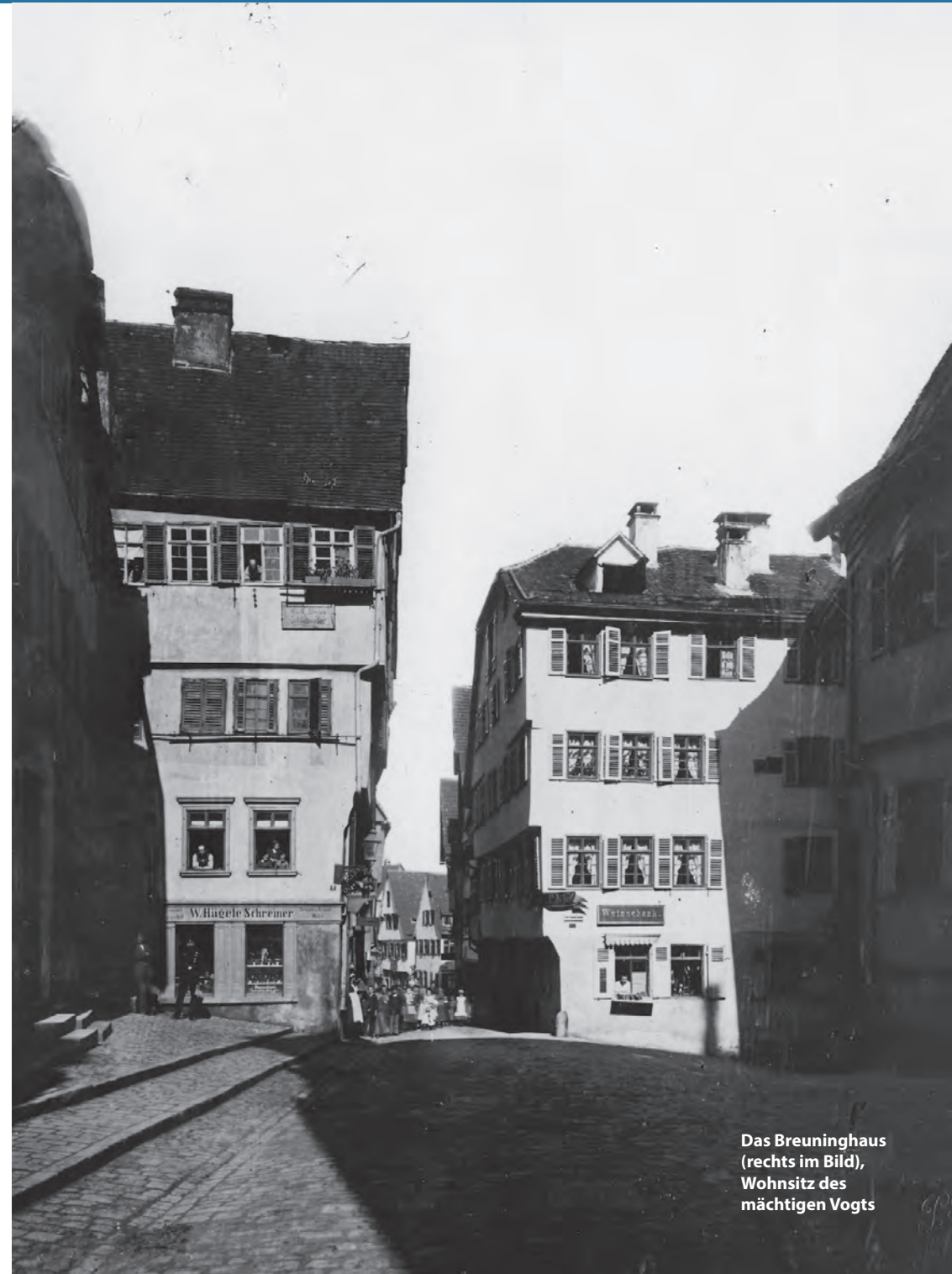
Das Breuninghaus (rechts im Bild), Wohnsitz des mächtigen Vogts