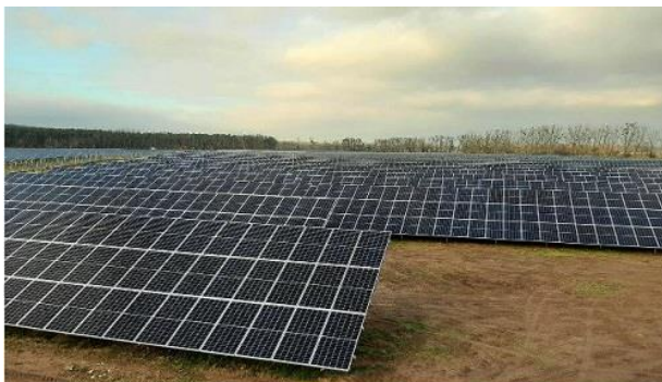
Solarpark "Metzdorf II"