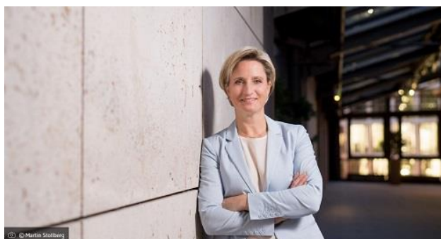
Dr. Nicole Hoffmeister-Kraut

Die Corona-Pandemie hat den Einzelhandel in seinen Grundfesten erschüttert und wird das Einkaufsverhalten vieler Kunden nachhaltig verändern. Mit der Initiative „Zeig mir was!“ steht dem Tübinger Handel ein effizientes und leicht zu bedienendes Tool zur Verfügung, um Kunden per Videochat beraten zu können und so zusätzliche Umsätze zu generieren. Interessierte Händler_innen können einen kostenlosen Beratungstermin vereinbaren: https://zeig-mir-tuebingen.de/