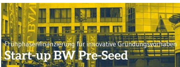
Grafik: Start-up BW Pre-Seed

Das Tübinger Medizintechnik-Unternehmen Solios diagnostics GmbH wurde im Rahmen der „Biotechnology Awards“ des britischen Magazins „Global Health & Pharma“ als Pionier und Innovator ausgezeichnet und darf sich nun „Bester Entwickler von Point-of-Care-Diagnosegeräten in Westeuropa 2023“ nennen. Das 2021 gegründete Unternehmen hat seinen Sitz in der Karlstraße 3. https://www.solios-dx.com/