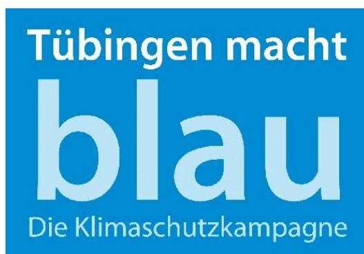
Logo: Tübingen macht blau