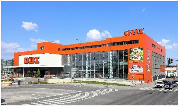
OBI-Markt in Wien.