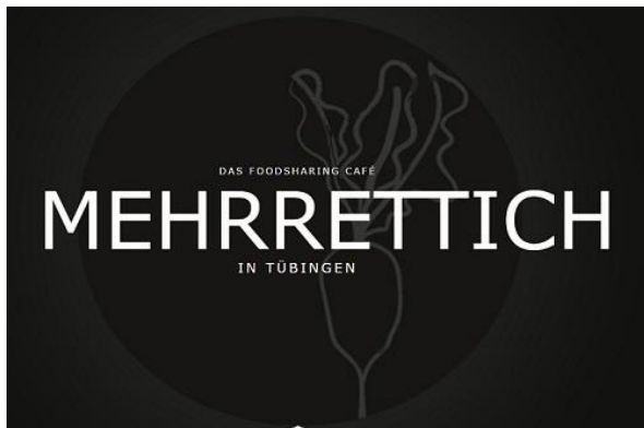
Grafik: Foodsharing-Café Mehrrettich