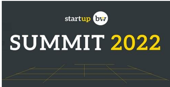
Bild: Start-up BW Summit 2022

Mehr als 20 Startups aus den medizinischen Life Sciences wurden bislang mit dem 4C Accelerator Tübingen und dem für die Rudolf-Diesel-Medaille nominierten Förderkonzept erfolgreich unterstützt – und es soll weitergehen! Gefördert wird das Programm durch die Kampagne „Start-Up BW“ des Wirtschaftsministeriums Baden-Württemberg, der Stiftung für Medizin-Innovationen und der B. Braun Stiftung. Bewerbungsschluss ist am 22. Juli. https://mi-incubator.com/en/4c-accelerator-tuebingen/?utm_medium=Mailing&utm_campaign=Announcement+4C+Q1-22