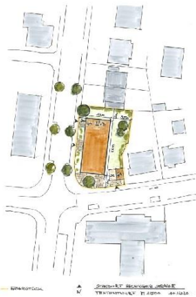
Testentwurf Hechinger Straße Bild: a+r Architekten

Eine neue Weihnachtsbeleuchtung sorgt seit dem ersten Advent für mehr Atmosphäre in der Altstadt: Mehrere Bäume wurden mit Leuchtkugeln bestückt, glitzernde Überspannungen schmücken die Burgsteige, und in einigen Gassen leuchten Sterne. Die WIT hat dieses Pilotprojekt mit Unterstützung des HGTV organisiert. Das neue Beleuchtungskonzept soll künftig auf weitere Standorte in der Altstadt ausgeweitet werden und die Giebelbeleuchtung ersetzen. Dazu ist im kommenden Jahr eine Informationsveranstaltung für alle Interessierten geplant. Kontakt: julia.winter@tuebingen.de