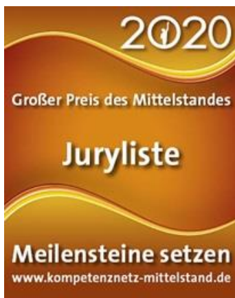
Bild: Großer Preis des Mittelstandes