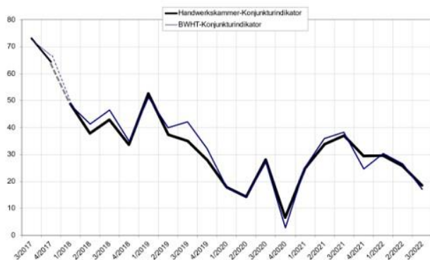
Grafik: Handwerkskammer Reutlingen

Außerdem haben sich die swt erfolgreich um Fördergelder im Rahmen der Richtlinie zur Förderung alternativer Antriebe von Bussen im Personenverkehr des Bundesministeriums für Digitales und Verkehr beworben. Das bedeutet für den TüBus große Schritte bei der Umrüstung der Busflotte auf E-Antriebe. Ab 2023 sollen nach und nach 44 neue E-Busse nach Tübingen rollen. Die Universitätsstadt kommt damit im Sektor Mobilität deutlich schneller den Klimaschutzziele für 2030 näher. https://www.swtue.de/