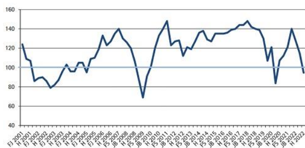
Grafik: IHK Reutlingen

Das regionale Handwerk richtet sich auf schwierige Monate ein. Jeder fünfte Betrieb, und damit doppelt so viele wie im Vorjahr, rechnet mit einer schlechteren wirtschaftlichen Lage. Sorgen bereitet vor allem der beschleunigte Preisanstieg bei Material, Rohstoffen und Energie. Das geht aus der Konjunkturumfrage der Handwerkskammer Reutlingen zum dritten Quartal 2022 hervor. Der Konjunkturindikator ging um rund 18 Punkte gegenüber dem Vorjahresquartal zurück. https://www.hwk-reutlingen.de/konjunktur