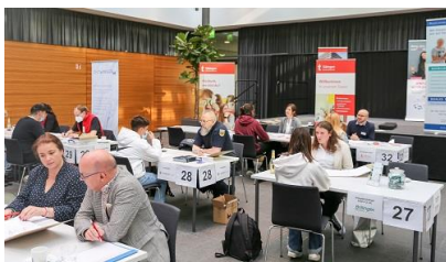
Bild: Azubi- Speeddating