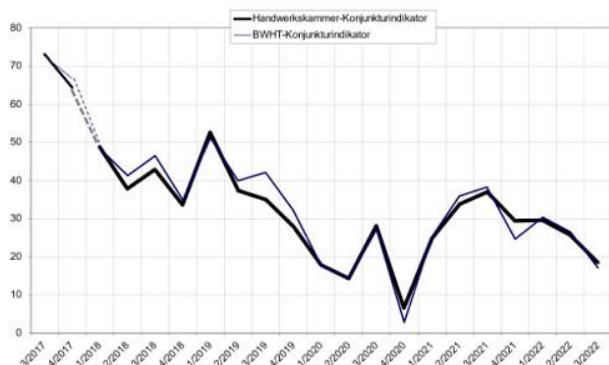
Grafik: Handwerkskammer Reutlingen

Außerdem haben sich die swt erfolgreich um Fördergelder im Rahmen der Richtlinie zur Förderung alternativer Antriebe von Bussen im Personenverkehr des Bundesministeriums für Digitales und Verkehr beworben. Das bedeutet für den TüBus große Schritte bei der Umrüstung der Busflotte auf E-Antriebe. Ab 2023 sollen nach und nach 44 neue E-Busse nach Tübingen rollen. Die Universitätsstadt kommt damit im Sektor Mobilität deutlich schneller den Klimaschutzzielen für 2030 näher. https://www.swtue.de/