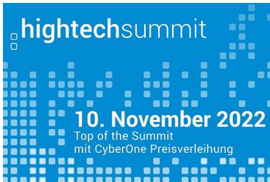
Logo: Hightech Summit