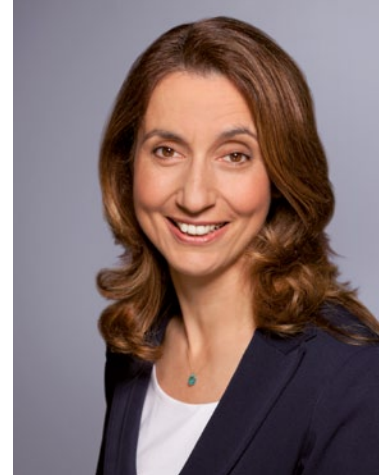
AYDAN ÖZOĞUZ Staatsministerin bei der Bundeskanzlerin Beauftragte der Bundesregierung für Migration, Flüchtlinge und Integration

Ich wünsche eine interessante Lektüre und hoffe, dass Sie sich auch weiterhin so engagiert für Flüchtlinge einsetzen. Sie leisten damit einen wichtigen Beitrag zum Zusammenhalt in unserem Land.