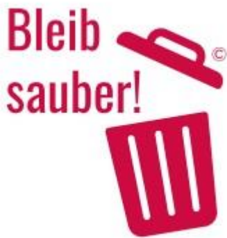
Grafik: dreivorzwölf marketing GmbH