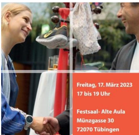
Grafik: Universitätsstadt Tübingen

https://worldcitizen.school/event/marktplatz-fuer-gute-geschaefte/