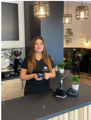
Standort