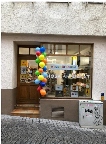
Bild: Kiosk am Markt

Im Rahmen des KI-Innovationswettbewerbs Baden-Württemberg nimmt die d-serv GmbH am Verbundforschungsprojekt „KI4VPB – Virtuelles Planungsbüro“ teil. Ziel des Projekts ist es, eine KI-gestützte Erfassung und Plausibilitätsprüfung von Bauplänen zu entwickeln und bis September als Prototyp bzw. Grundlage für eine spätere Produktentwicklung bereitzustellen. Projektpartner sind die bwcon research gGmbH, das Institut für Enterprise Systems der Universität Mannheim, die Loidl GmbH und die The Chainless GmbH. https://www.dserv.de/