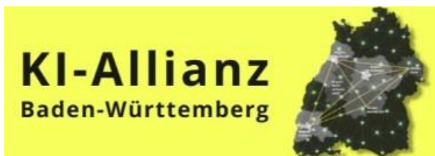
Logo: KI Allianz Baden-Württemberg