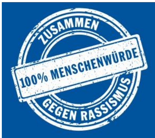
Logo: Stiftung gegen Rassismus