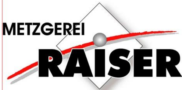
Logo: Metzgerei Raiser