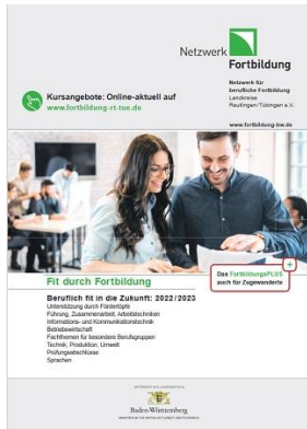
Grafik: Netzwerk Fortbildung