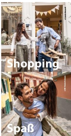
Bild: Ausschnitt der Anzeige