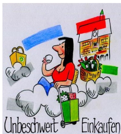
Bild: Unbeschwert einkaufen