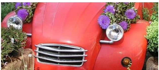
Bildausschnitt: Universitätsstadt / Buchegger

Die Stadtwerke Tübingen (swt) erneuern ab 4. Juli die Gas- und Wasserleitung sowie einige Hausanschlüsse in der Straße Vor dem Kreuzberg, beginnend bei der Buswendeplatte bis etwa vor Haus Nr. 20. Notwendige Unterbrechungen der Wasserversorgung werden den Hauseigentümern vorab schriftlich durch die swt mitgeteilt. Teilweise müssen Parkplätze gesperrt werden. Zufahrten für den Lieferverkehr sind weiterhin möglich. Kontakt: romy.schimpf@swtue.de