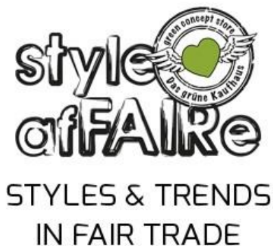
Grafik: Style afFAIRE