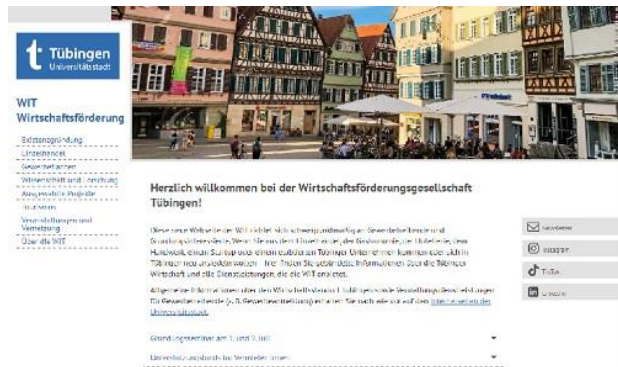
Bild: Vorschau auf die neue Webseite