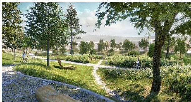
Koeber Landschaftsarchitektur GmbH

In derselben Sitzung votierte der Gemeinderat mit deutlicher Mehrheit, jedoch mit 13 Gegenstimmen, für die dauerhafte Sperrung der Mühlstraße für Autos. Ausgenommen von der Sperrung sind Busse, Taxis und der Lieferverkehr. Für den Radverkehr soll eine Abbiegemöglichkeit von der Mühlstraße in die Gartenstraße eingerichtet werden. Der bestehende Radstreifen auf der Neckarbrücke und vorderen Wilhelmstraße soll auch bleiben. https://www.tuebingen.de/gemeinderat/vo0050.php?kvonr=16916