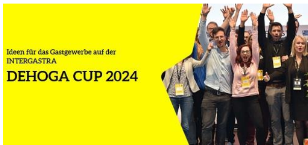
Bild: DEHOGA CUP