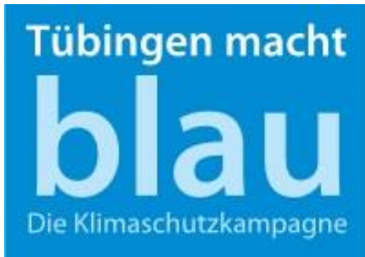
Logo: Tübingen macht blau