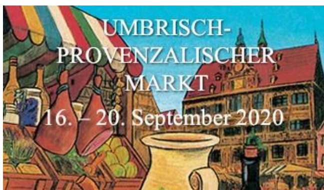
Grafik: Universitätsstadt Tübingen

https://www.schwaebischealb.de/albcard/freiefahrt