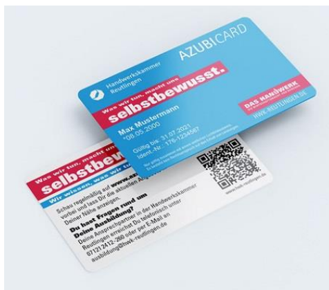
Grafik: HWK Reutlingen/ Mockups Design

Im Rahmen des monatlich stattfindenden Gründer-Meetups des Neckar Hubs wird am 30. Juli um 16 Uhr das neue „Coworking Café“ im Shooter Stars (Wilhelmstraße 16) in Tübingen eröffnet. Das Coworking Café öffnet seine Pforten offiziell am 1. August von 10 bis 18 Uhr für Coworking-Interessierte. Gebucht wird beim Neckar Hub zu den üblichen Preisen. Kontakt: s.mueller@neckar-hub.com http://neckar-hub.com/