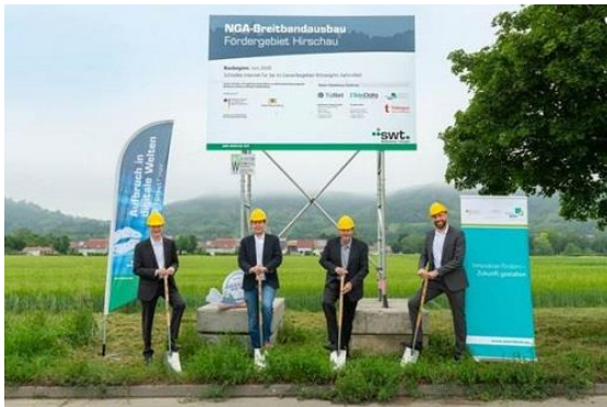
Der Spatenstich erfolgte Mitte Juni.