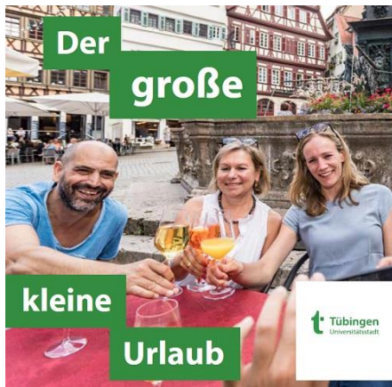
Grafik: Benning, Gluth & Partner