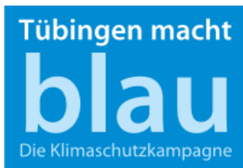
Logo: Tübingen macht blau