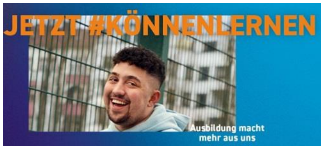
Grafik: jetzt #könnenlernen