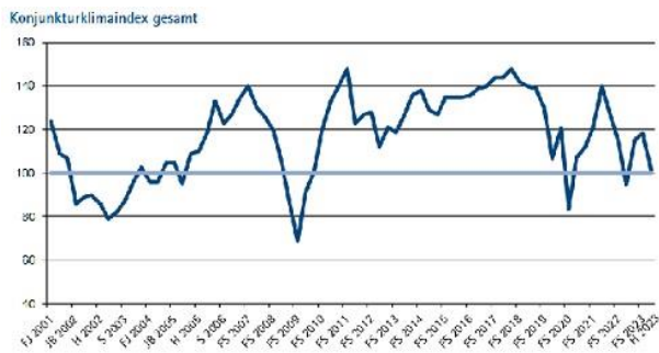
Grafik: IHK Reutlingen