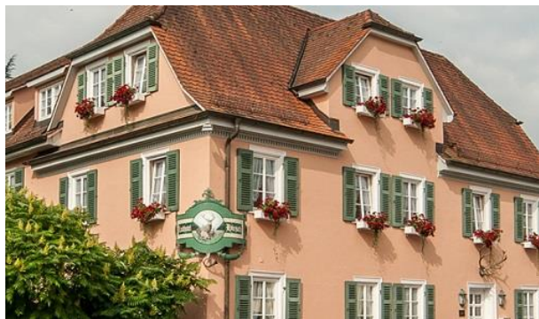
Bildausschnitt: Restaurant-Landhotel Hirsch