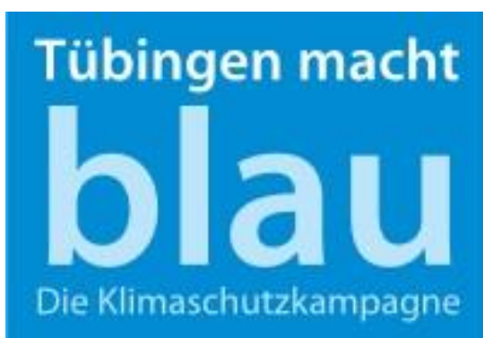
Logo: Tübingen macht blau