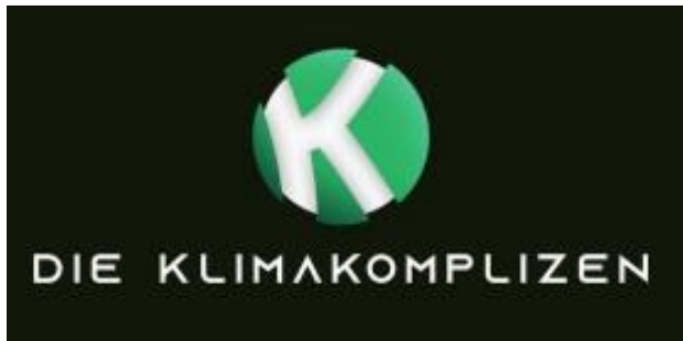
Logo: Die Klimakomplizen