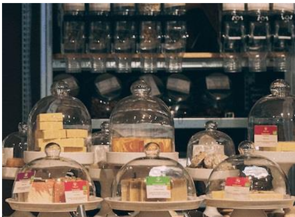
Bildausschnitt: Fridi unverpackt GmbH