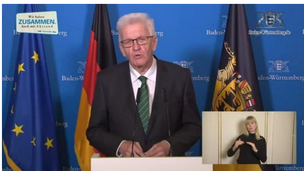
Ministerpräsident Kretschmann Screenshot baden-wuerttemberg.de