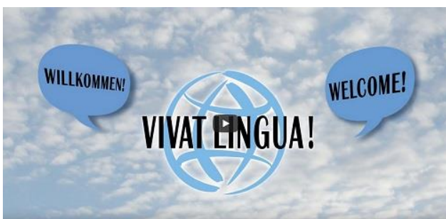
Screenshot Vivat Lingua! Video