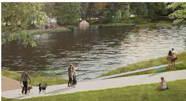
Bildausschnitt: bhm Planungsgesellschaft/Filon Leipzig