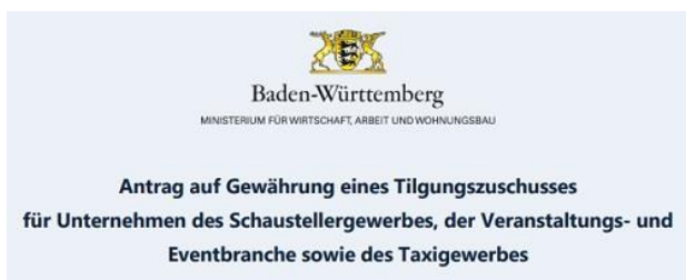
Bild: Antragsformular Ministerium für Wirtschaft, Arbeit und Wohnungsbau Baden-Württemberg