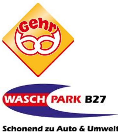
Logos: Bäckerei Gehr / Waschpark B27