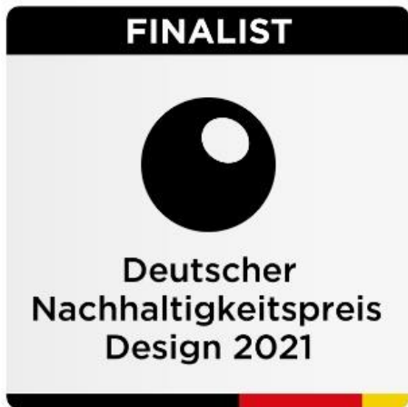
Grafik: Deutscher Nachhaltigkeitspreis