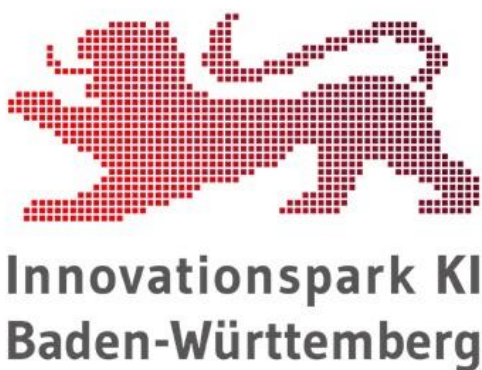
Logo: Innovationspark KI Baden-Württemberg