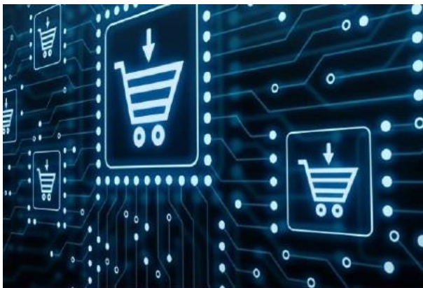
Bildausschnitt Veranstaltungsflyer der IHK

https://www.tuebingen.de/fluechtlinge/17117.html#/24850