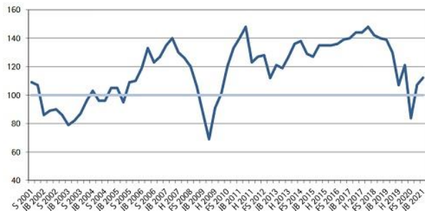
Grafik: IHK Reutlingen

Die Region Neckar-Alb (mit Tübingen und Reutlingen) sowie Stuttgart und Karlsruhe sind ein paar Schritte weiter auf dem Weg zum baden-württembergischen Innovationspark für Künstliche Intelligenz: Am 19. Februar gründeten elf Partner aus den Regionen eine Betreiber-Dachgenossenschaft, und drei Tage später reichten sie einen detaillierten Projektplan beim Wirtschaftsministerium ein. Das endgültige Gesamtkonzept muss diesem bis zum 10. März vorliegen. www.innovationspark-ki-bw.de