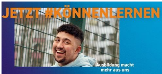
Grafik: jetzt #könnenlernen