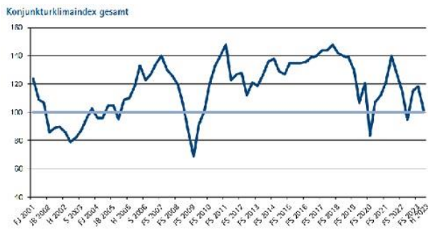
Grafik: IHK Reutlingen