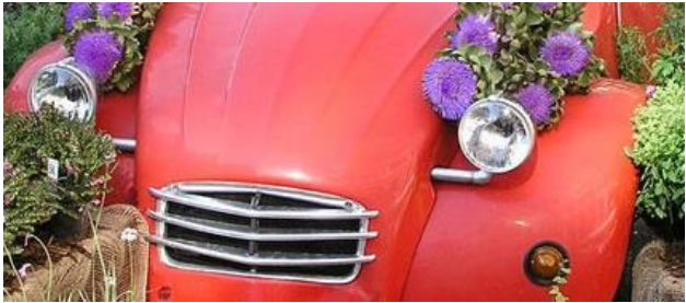
Bildausschnitt: Universitätsstadt / Buchegger

Die Stadtwerke Tübingen (swt) erneuern ab 4. Juli die Gas- und Wasserleitung sowie einige Hausanschlüsse in der Straße Vor dem Kreuzberg, beginnend bei der Buswendeplatte bis etwa vor Haus Nr. 20. Notwendige Unterbrechungen der Wasserversorgung werden den Hauseigentümern vorab schriftlich durch die swt mitgeteilt. Teilweise müssen Parkplätze gesperrt werden. Zufahrten für den Lieferverkehr sind weiterhin möglich. Kontakt: romy.schimpf@swtue.de