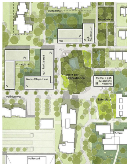
Der „Platz der Generationen“ zwischen Pappelwiese und Weißdornweg.