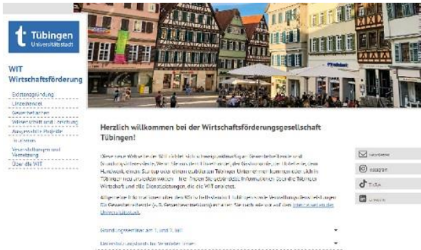
Bild: Vorschau auf die neue Webseite