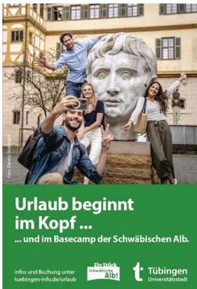
Anzeige im MERIAN Schwäbische Alb

Seit dem ersten Advent leuchten in der Tübinger Altstadt wieder die Elemente der im letzten Jahr neu angeschafften Weihnachtsbeleuchtung und sorgen für mehr Atmosphäre beim Einkaufen und Bummeln: Auf Initiative der WIT wurden mehrere Bäume mit Leuchtkugeln bestückt, Überspannungen schmücken die Burgsteige, und in verschiedenen Gassen glitzern Sterne. Diese Weihnachtsbeleuchtung geht bis Ende Januar 2022 und ergänzt die traditionelle Giebelbeleuchtung, die ab dem kommenden Jahr entfernt wird. Kontakt: julia.winter@tuebingen.de