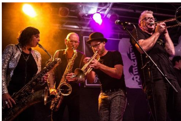
Bild: Louisiana Funky Butts Brassband