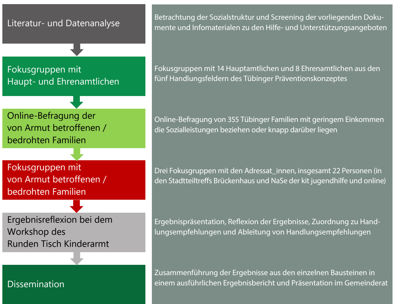
Abbildung 1: Ablauf der Evaluation

Das methodische Vorgehen ist von einem ‚Mixed-Methods-Design‘ geprägt, in dem verschiedene Methoden, eine quantitative Erhebung, qualitative Erhebungen sowie Dokumentenanalysen miteinander verbunden wurden. Konzeptionell wurde die Evaluation mittels verschiedener aufeinander aufbauender Module geleistet, die in Abbildung 1 dargestellt sind. Das komplexe und mehrdimensionale Studiendesign richtet den Fokus da-