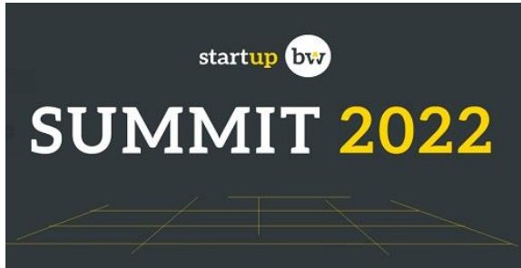
Bild: Start-up BW Summit 2022

Mehr als 20 Startups aus den medizinischen Life Sciences wurden bislang mit dem 4C Accelerator Tübingen und dem für die Rudolf-Diesel-Medaille nominierten Förderkonzept erfolgreich unterstützt – und es soll weitergehen! Gefördert wird das Programm durch die Kampagne „Start-Up BW“ des Wirtschaftsministeriums Baden-Württemberg, der Stiftung für Medizin-Innovationen und der B. Braun Stiftung. Bewerbungsschluss ist am 22. Juli. https://mi-incubator.com/en/4c-accelerator-tuebingen/?utm_medium=Mailing&utm_campaign=Announcement+4C+Q1-22