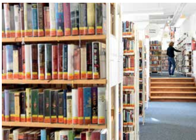
Die Belletristik-Abteilung der Stadtbücherei.