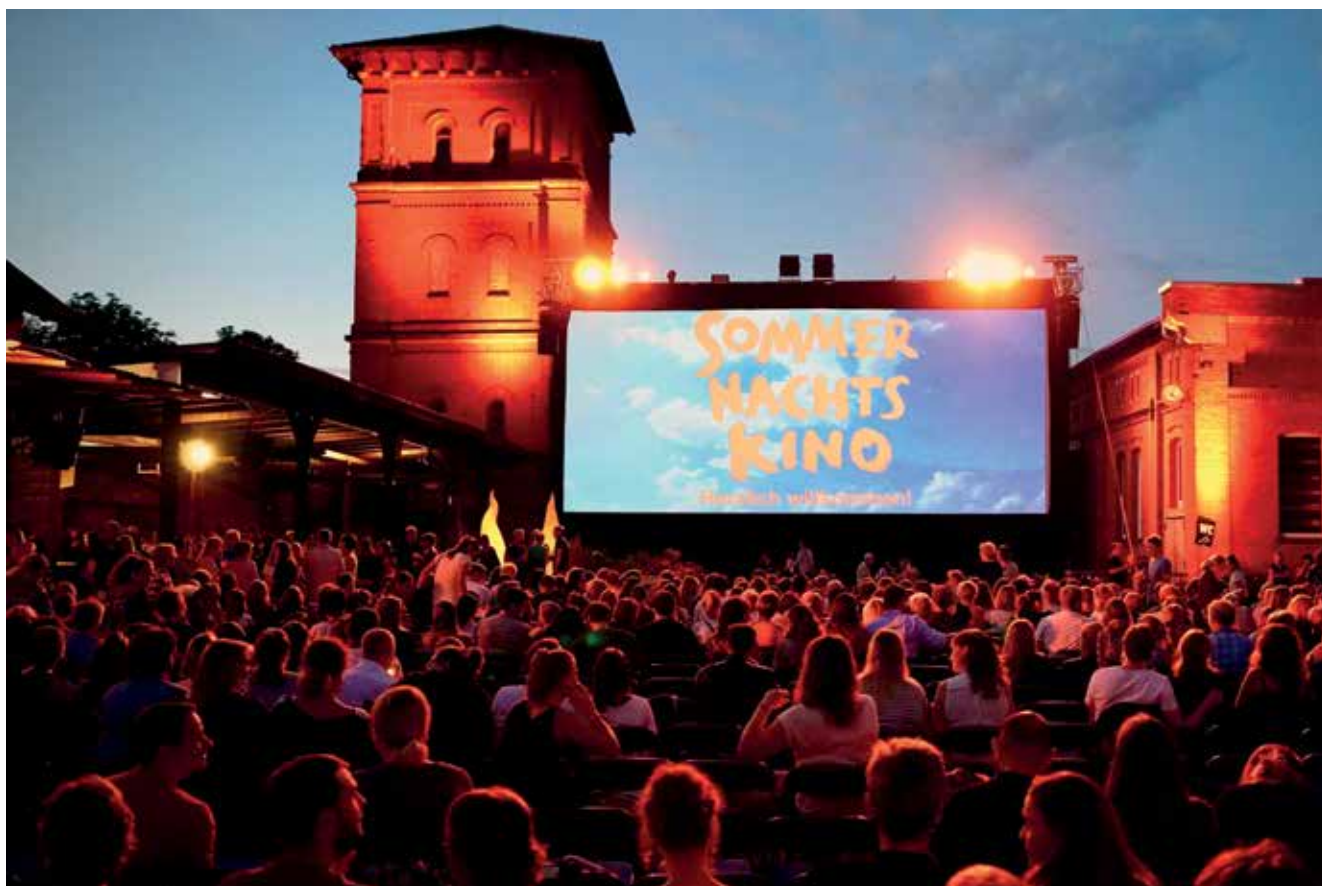
Sommernachtskino Tübingen.

Tübingen hat eine in seiner Vielfalt einmalige Tradition an Filmfestivals. Die Verwaltung schätzt die engagierte,