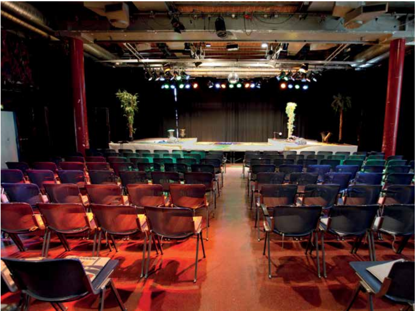
Der Große Saal im Sudhaus.

soll aber nicht unter der Vorgabe erfolgen, bei einzelnen Vereinen oder Einrichtungen Zuschusskürzungen vorzunehmen, sondern vielmehr allen Kulturakteuren gleiche Voraussetzungen zu schaffen. Zudem sehen die Förderrichtlinien vor, dass dem Gemeinderat in regelmäßigen Abständen eine tabellarische Zusammenfassung der Ergebnisse der Evaluation vorgelegt wird. Viele Regelschüsse wurden in den 1970er oder 1980er Jahren festgelegt und seither weder evaluiert noch verändert, d.h. über den tatsächlichen Bedarf kann hier keine Aussage getroffen werden. In einigen Sparten, zum Beispiel in der Chor- und Orchesterförderung, gibt es keine einheitliche Verfahrensweise: Von 42 Chören beziehen nur knapp die Hälfte eine Regelförderung. Weitere Fragen stellen sich auch in Bezug auf die Entstehung von neuen Festivals und Angeboten, die in ähnlicher Weise schon existieren (zum Beispiel Musik- und Filmfestivals). Wie werden diese beurteilt? Sollen sie in eine Regelförderung aufgenommen werden?