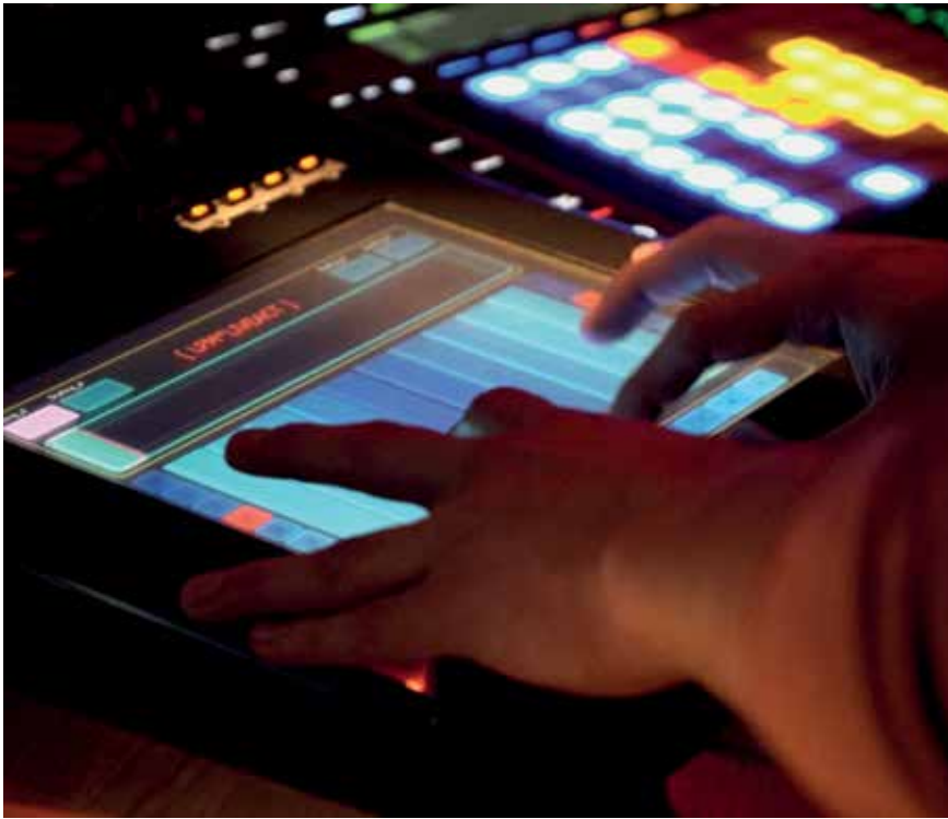
Medienkunst- Performance im Rahmen der Veranstaltung „Kunst! mit Lucas Gutierrez 2017“ des FabLab Neckar-Alb e.V.

Um Menschen mit Beeinträchtigungen besser in das kulturelle Leben einzubinden, hat der Fachbereich Kunst und Kultur – im Zusammenhang mit dem Konzept Barrierefreie Stadt – die Fachgruppe Kultur gegründet. Diese Fachgruppe, eine Plattform der Vernetzung und Vermittlung, trifft sich zweimal im Jahr und ist für alle Menschen mit und ohne Behinderungen offen. Sie bietet Austauschmöglichkeiten für Engagierte aus dem Bereich Inklusion wie für Kulturakteure zu Themen der Inklusion und Barrierefreiheit in der Kultur und eröffnet die Chance, verschiedene Perspektiven und Wünsche in die städtische Kultur einzuspeisen.