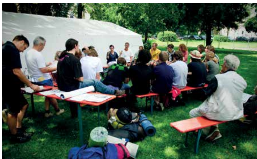
Workshop während des Ract!-Festivals.

Im Bereich der Soziokultur sieht der Fachbereich gegenüber den in der Kulturkonzeption festgehaltenen Leitlinien keinen prinzipiellen Änderungsbedarf. Ziel ist es zu gewährleisten, dass soziokulturelle Projekte weiterhin ihre freien Räume und Unterstützung finden. Aus Sicht des Fachbereichs Kunst und Kultur wären gerade im Bereich der Soziokultur künftig vermehrt Projekte wünschenswert, die unter dem Stichwort „Innovation“ neue ästhetische Vermittlungsformen und Inhalte in die Tübinger Öffentlichkeit tragen.