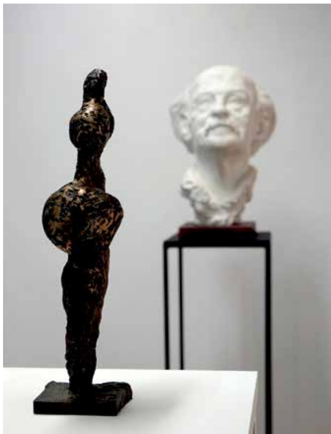
Ausstellung „Begegnung mit Ugge“ in der Kulturhalle.

Eine weitere Schwerpunktsetzung und damit einhergehende Verbesserungen gab es im Bereich der Förderung, präziser: der Breitenförderung. Im Zusammenhang mit den Förderrichtlinien etwa fiel auf, dass viele Mitglieder der Chorgemeinschaft kaum etwas über die Möglichkeit der Projektförderung (und das Verfahren der Förderung ihrer Chöre über die Chorgemeinschaft) wussten; hier wurde über eine Informationsveranstaltung und regelmäßigeren Kontakt eine Verbesserung erzielt. Auch die Arbeit der Tübinger Musikvereine wurde durch eine Erhöhung des Regelzuschusses gewürdigt. Generell konnte auf der Basis der Förderrichtlinien die Vergabe von Projektzuschüssen justiert werden: Stärker als bisher gefördert werden nun vor allem Projekte, die einen neuen musikalischen Ansatz verfolgen, ein junges Publikum