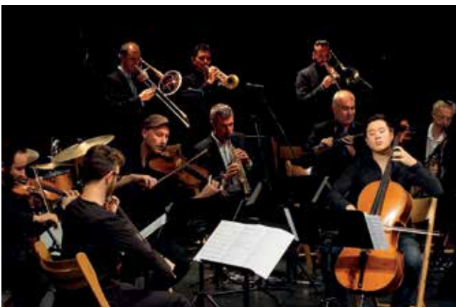
Joe Haider Jazz Orchestra mit dem Kaleidoscope String Quartet.

Auch die städtische Unterstützung für die Wallander-Oper im Festsaal der Universität Tübingen im Juli 2016 und die im November 2017 auf die Bühne gebrachte Produktion der Jommelli-Oper zeugen von dieser Schwerpunktsetzung, den Bereich der Musik auch durch große Veranstaltungen voranzubringen und eine dauerhafte Wirkung und Vernetzung unterschiedlicher Akteure in Tübingen zu erreichen.