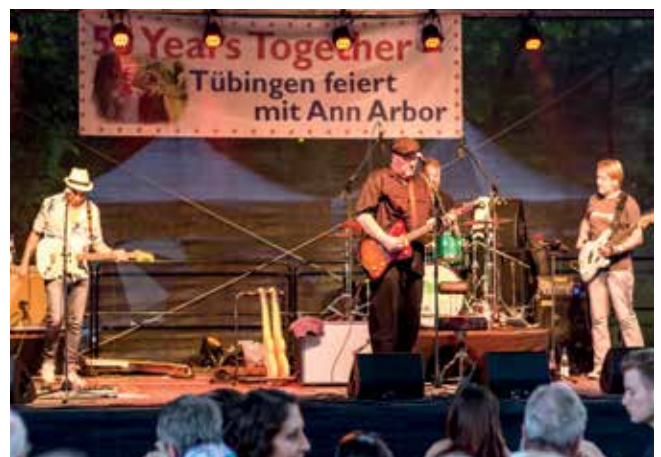
Fest zum 50. Jubiläum der Städtepartnerschaft mit Ann Arbor.

Dementsprechend wurde ein Konzept für die Neupositionierung der Städtepartnerschaften entwickelt und im Gemeinderat vorgestellt. Und: Der Fachbereich Kunst und Kultur hat in den letzten Jahren den Schwerpunkt in der Partnerschaftsarbeit noch stärker auf die inhaltliche Zusammenarbeit und den thematischen Austausch mit den Partnerstädten gelegt.