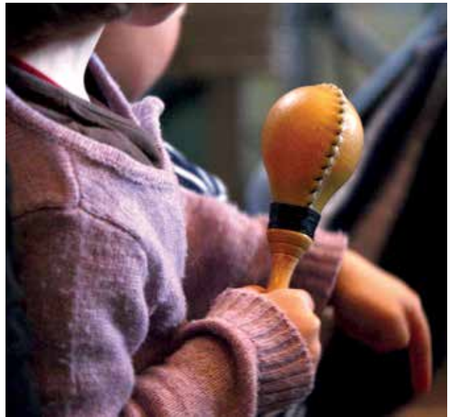
Musikschule Tübingen.

Die Musikschule setzt sich verstärkt für Angebote für Menschen mit Behinderung ein. An der Musikschule arbeiten drei Musiklehrkräfte, die neben der musikalischen Ausbildung eine Fortbildung für sonderpädagogisch orientierten Musikunterricht haben. Ein wichtiges Thema für die Tübinger Musikschule ist die Frage der Bildungsgerechtigkeit. Die Musikschule möchte mit ihren Angeboten alle Tübingerinnen und Tübinger erreichen. Wichtige Partner, um Familien mit geringem Einkommen den Unterricht zu ermöglichen, sind die Aktion Sahnehäubchen und die Organisation Inner Wheel. Ebenso zentral ist hier auch die Förderung durch die KinderCard. In den letzten Jahren hat die Anzahl der Nutzerinnen und Nutzer mit KinderCard, die Angebote der Musikschule wahrnehmen, kontinuierlich zugenommen. Zusätzlich gewährt die Musikschule Ermäßigungen für Geschwister und Mehrfächerbelegungen. Im ersten Unterrichtsjahr können Instrumente aus dem großen Instrumentenpool der Musikschule zu günstigen Gebühren genutzt werden.