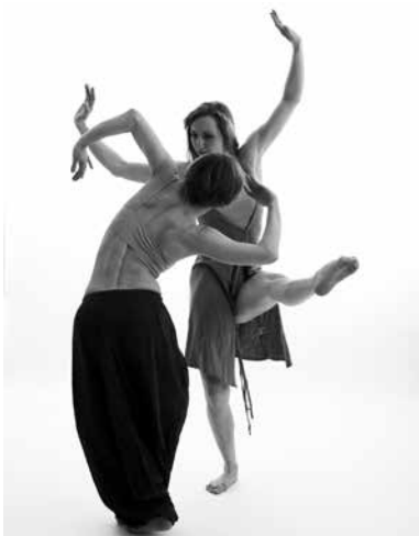
InzTanz – Internationales Zentrum für Tanz

Den Tanz in seiner künstlerischen Ausprägung stärker in das Bewusstsein der Tübinger Öffentlichkeit zu heben, ist nach wie vor ein Ziel städtischer Kulturpolitik. Realistischerweise muss allerdings festgehalten werden, dass dieser Bereich nicht zu den Schwerpunkten der Kulturverwaltung gehört, in denen sie von sich heraus in besonderem Maße aktiv werden wird. Wenn aus der Tanzszene selbst Impulse kommen, den Künstlerischen Tanz stärker voranzubringen, so wird ihr die Verwaltung allerdings gerne mit Mitteln der Projektunterstützung zur Seite stehen.