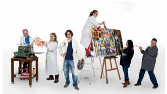
Kunst in der Lebenshilfe Tübingen.

Anbieter Auskunft gibt. Die Informationsseite bündelt außerdem Informationen zur Förderung von Projekten im Bereich Kultureller Bildung und dokumentiert den Beteiligungsprozess sowie die Netzwerk- und Thementage. Interessierte Nutzerinnen und Nutzer können auf diese Weise einen Überblick über derzeitige Angebote erhalten sowie neue Projektpartner und Fördermöglichkeiten finden.