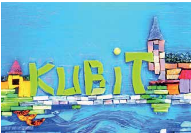
Kubit-Mosaik, Mosaikkunst ScherbenGlück.

Geplant ist auch die Einrichtung einer internen städtischen Steuerungsgruppe, die sich über das Querschnittsthema Kulturelle Bildung austauscht und abstimmt.