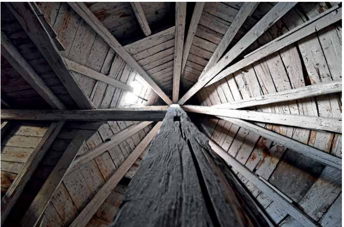
Blick in die Turmspitze.

In enger Verbindung mit dem Hölderlinturm und dem Hesse Kabinett als zentralen literarischen Erinnerungsorten in Tübingen steht die Einrichtung eines Literaturpfades (siehe Literatur).