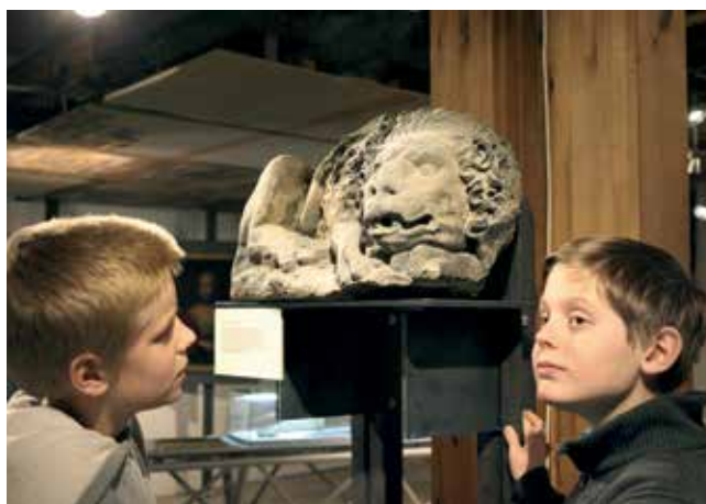
Der Reuchlin-Löwe in der Dauerausstellung zur Tübinger Stadtgeschichte.