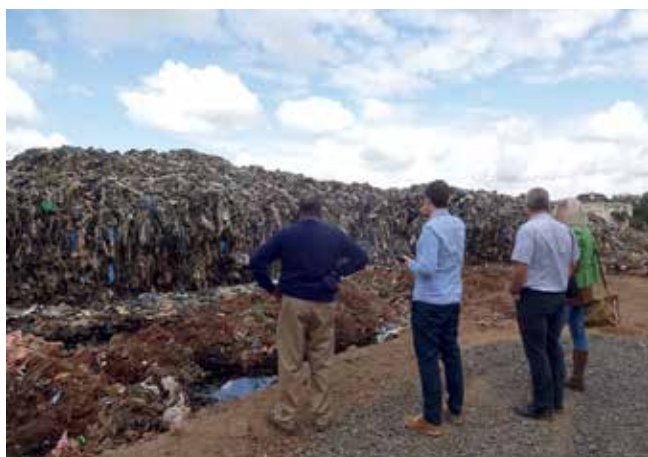
Entwicklungspolitische Zusammenarbeit im Bereich Müll mit Moshi.

In der Städtepartnerschaft mit Petrosawodsk rücken ebenfalls zunehmend Sachthemen in den Vordergrund. Nach dem angesprochenen Jubiläumsprogramm wurde ein Fachaustausch zum Thema „Geschichte vermitteln“ zwischen Pädagoginnen und Pädagogen, Museumsmitarbeiterinnen und -mitarbeitern in beiden Städten durchgeführt. Gemeinsam mit der Fakultät für Politikwissenschaft der Universität Tübingen wurde eine Konferenz zum Thema Bürgerschaftliches Engagement und Zivilgesellschaft veranstaltet. Diese Konferenz führte zu einem anhaltenden gemeinsamen Forschungsaustausch.