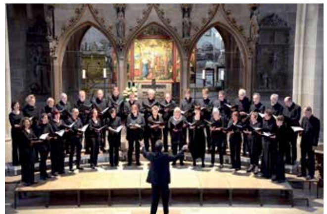
Der südwestdeutsche Kammerchor Tübingen in der Stiftskirche.