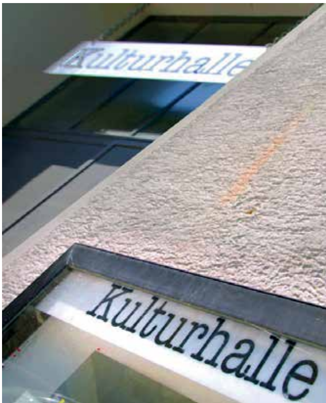
Die Kulturhalle – der Ausstellungsraum des Fachbereichs Kunst und Kultur.

Im vielfältigen Neben- und Miteinander der Tübinger Kulturlandschaft mit ihren zahlreichen Initiativen und