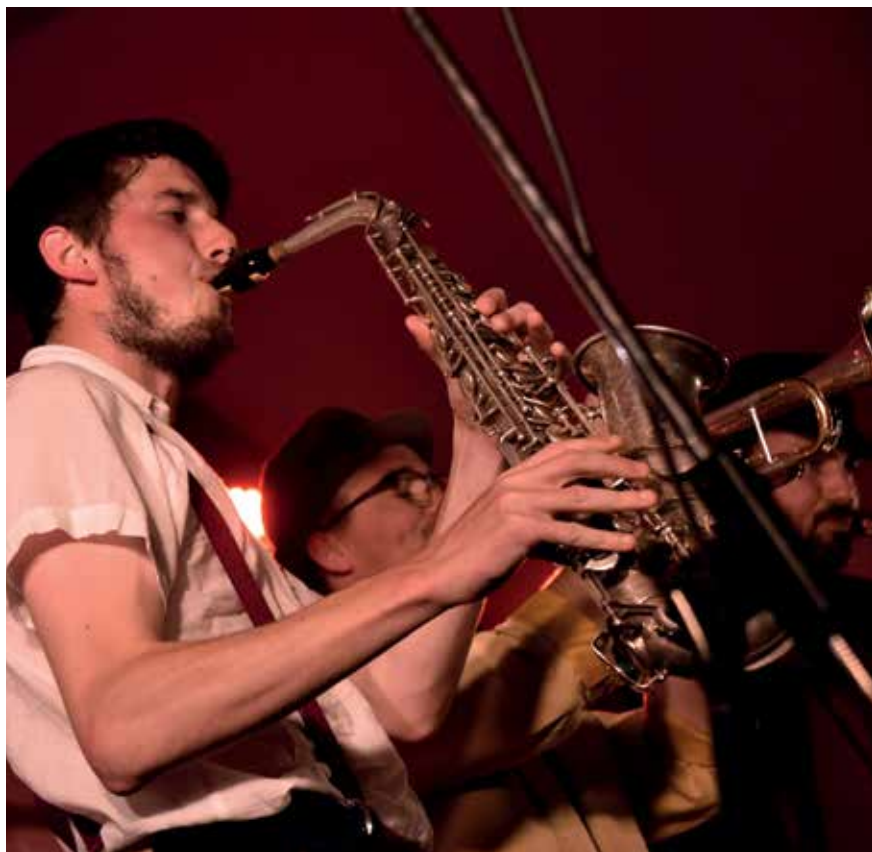
Großes Sommerfest des Deutsch-Französischen Kulturinstituts Tübingen 2016 mit der französischen Band Fatras.

organisiert, unterstützt oder gefördert, die das Thema Flucht und Vertreibung zum Inhalt hatte. Im Stadtmu-