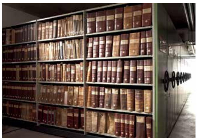
Einblick in das Magazin des Stadtarchivs.