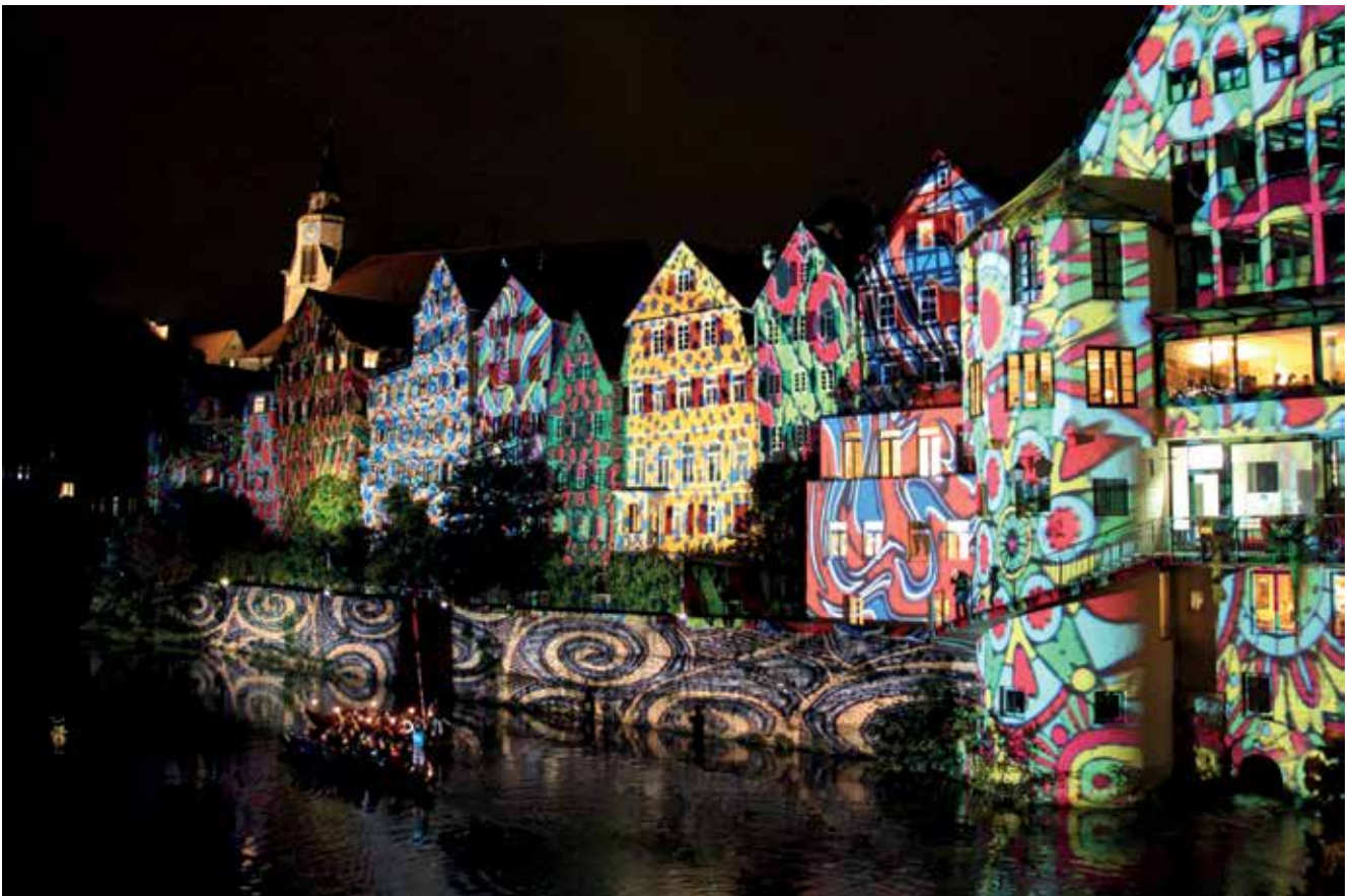
Lange Nacht des Denkmals 2014.

Den schlechten Erforschungsgrad der Altstadt Häuser belegen immer wieder aktuelle Bauforschungen. So wurden etwa jüngst im Kleinen Ämmerle 3-5 völlig überraschend die ältesten Dendrodaten in der Tübinger Unterstadt gezogen (1409). Das Anwesen erwies sich jedoch als nicht mehr sanierungsfähig und musste teilweise abgebrochen werden. Nicht nur in diesem Fall waren die Bemühungen um den Erhalt historischer Bausubstanz erfolglos. Auch einige andere Gebäude fielen aus ähnlichen Gründen dem Abbruch zum Opfer.