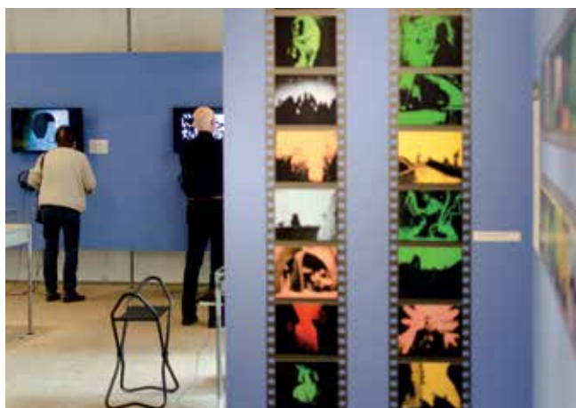
Die Lotte-Reiniger-Ausstellung im Stadtmuseum.

Darüber hinaus erhöht das Kornhaus seine Anziehungskraft durch kleine Ausstellungsformate, die in Zusammenarbeit mit unterschiedlichen Kooperationspartnern entstehen. So zum Beispiel die Belebung der stadtgeschichtlichen Dauerausstellung durch „Interventionsausstellungen“: Kunst in Dialog mit dem Stadtmuseum (seit 2014, zusammen mit regionalen Kunstschaffenden), 150 Jahre Silcherbund (2015, zusammen mit dem gleichnamigen Chor) und Burschen und Bürger (2017, zusammen mit dem Arbeitskreis Tübinger Verbindungen). Auch die Dauerausstellung zu Lotte Reiniger gewann mit zusätzlichen thematischen Wechselausstellungen (2015: Lotte Reiniger und der frühe Trickfilm) an Attraktivität. Die Einrichtung des KIDS-Raums mit Scherenschnitt-, Trickfilm- und Schattenspiel- Mitmachstationen hat ebenfalls dazu beigetragen, dass Lotte Reiniger und ihre Arbeit wieder