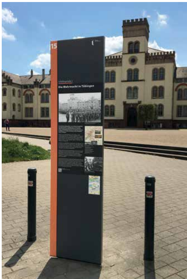
Stele des Geschichtspfads zum Nationalsozialismus vor der Thiepval-Kaserne.

Die Theater sind Teil der kulturellen Grundversorgung. Daher ist es weiterhin kulturpolitisches Ziel, eine verlässliche Finanzierung zu sichern und über die Projektförderung auch solche Theaterproduktionen zu unterstützen, die zum Beispiel neue Zielgruppen ansprechen oder neue Orte bespielen. Die Förderung von Kooperationen und spartenübergreifenden Projekten ist hingegen bisher nicht in ausreichendem Maß gelungen und soll ebenfalls weiter verfolgt werden.