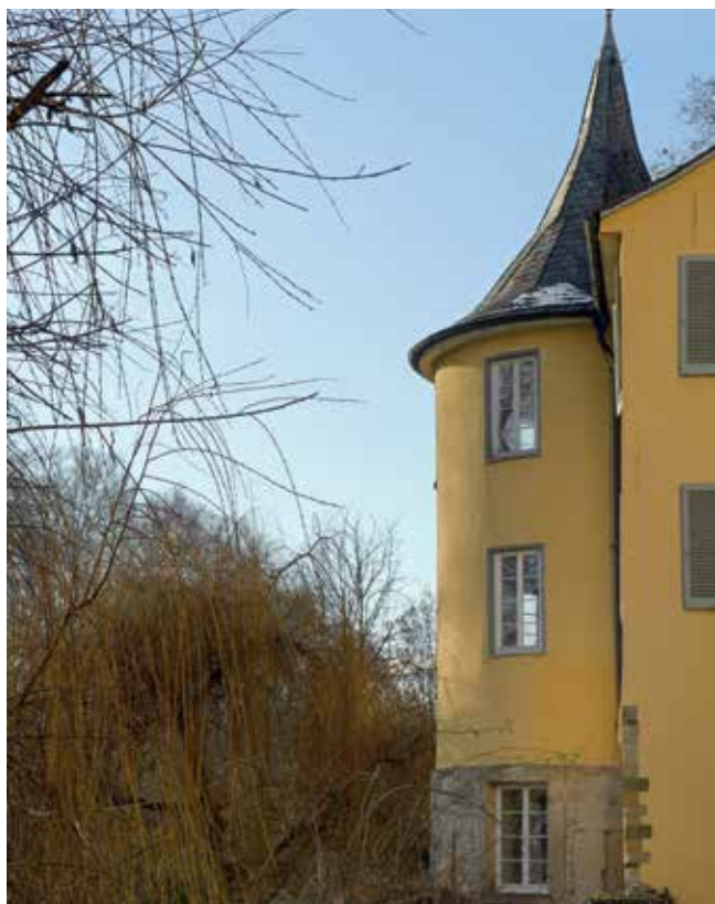
Hölderlinturm im Winter.

Erreicht werden soll diese Weiterentwicklung des Zimmertheaters durch die Einführung neuer künstlerischer und diskursiver Formen der Stückentwicklung und Inszenierung, durch die Verortung in der Theater- und Literaturlandschaft der Stadt, durch aktuelle Methoden des Kulturmanagements und den stärkeren Einbezug digitaler Medien und nicht zuletzt durch die Umstellung des Spielbetriebs auf einen semi-stagione-Betrieb.