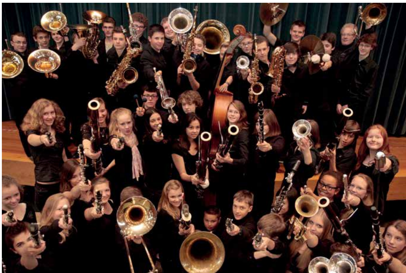
Musikschule Tübingen.

An der Tübinger Musikschule können Kinder, Jugendliche und Erwachsene eine vokale und eine instrumentale Ausbildung in nahezu allen gängigen Instrumenten des Klassik-, Jazz-, Rock und Popbereichs erhalten. Darüber hinaus bildet das gemeinsame Musizieren in einer der 28 Ensembles und Orchester eine wichtige Ergänzung. Gerade durch die Kammermusik und das Orchesterspiel werden zusätzliche Aspekte der musikalischen Bildung gefördert und vertieft.