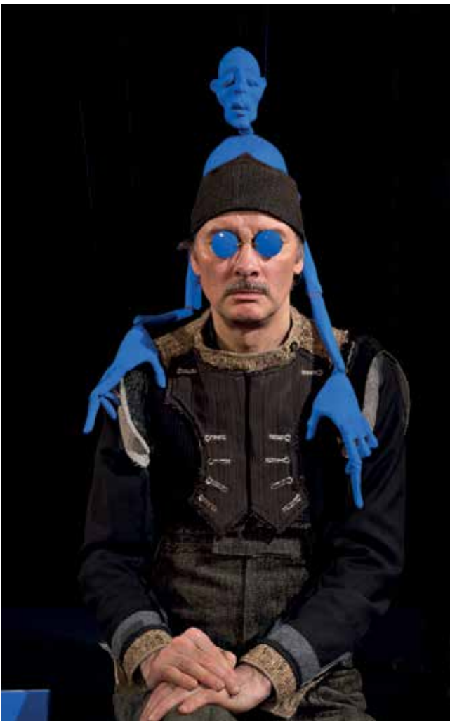
Figurentheater Tübingen mit der Inszenierung „Wunderkammer - Betrachtungen über das Staunen“.

In den Blick genommen werden muss eventuell auch die Situation der Tübinger Programmkinos: In Zeiten einer sich in technologischer wie wirtschaftlicher Sicht stark verändernden Kinolandschaft – vor dem Hintergrund einer Konzentration auf dem Film- und Verleihmarkt und angesichts veränderter Sehgewohnheiten und der Konkurrenz durch Online-Angebote – stehen diese unter besonderem Druck. Zu diskutieren ist, ob und in welcher Form die städtische Kulturpolitik hier eingreifen kann, um diese Orte unabhängiger Filmkultur zu erhalten.