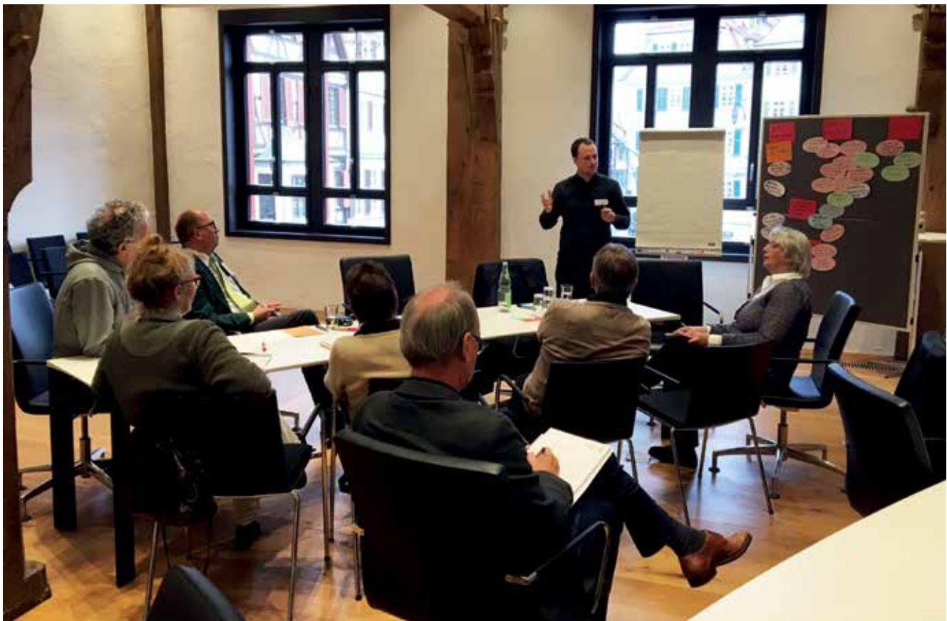
Workshop zur Zwischenbilanz der Kulturkonzeption im Oktober 2017.