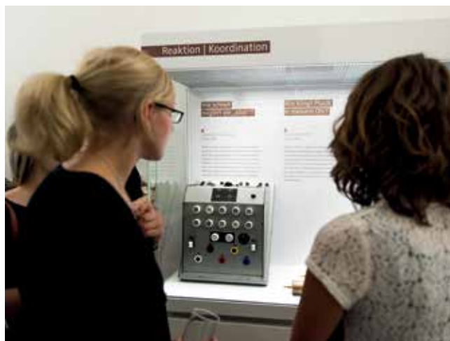
Psychologische Sammlung des Museums der Universität (MUT).

Wesentliches Ziel der Kulturkonzeption 2012 war, das Angebot in den Museen in städtischer Trägerschaft attraktiver zu gestalten. Zudem sollten Instrumente entwickelt werden, um Kooperationen zwischen den Museen zu stärken und eine gemeinsame Vermarktung (zum Beispiel Museumscard, „Museumsmeile“) voranzutreiben.