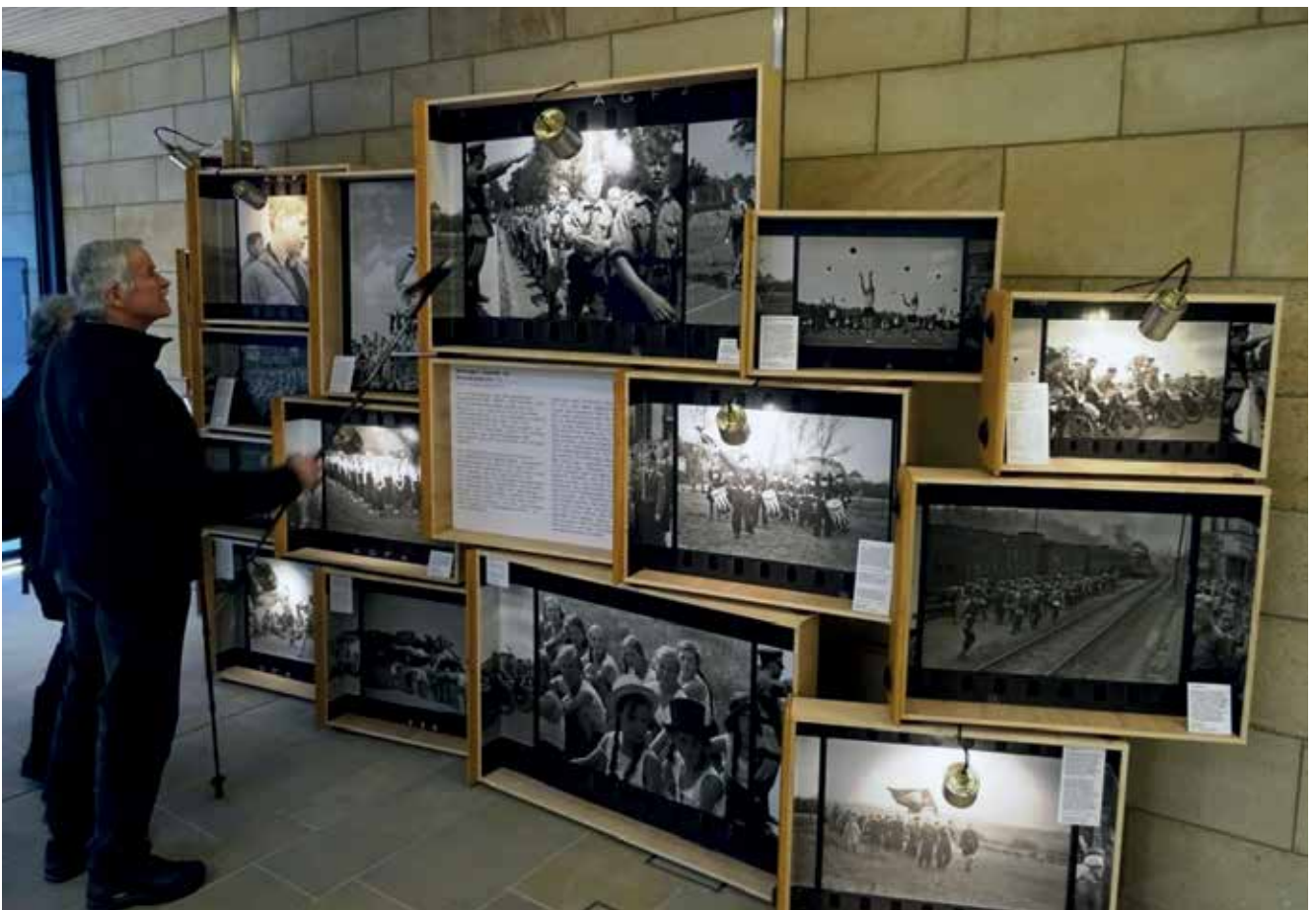
Ausstellung „Tübinger Jugend im Gleichschritt?! – Eine Fotodokumentation“ im Foyer des Rathauses.

Von Bedeutung für diesen Bereich des städtischen Kulturlebens und der städtischen Kulturpolitik sind selbstverständlich und nach wie vor die zahlreichen Aktivitäten der verschiedenen Institutionen und Initiativen, etwa der Geschichtswerkstatt und des LDNS e.V, des Fördervereins für jüdische Kultur in Tübingen, des Landkreises mit seinem Jugendguide-Projekt, der Volkshochschule mit ihren Bildungs- und Informationsangeboten oder seit jünger Zeit der Stolperstein-Initiative. Hier ist aber seit einiger Zeit eine grundsätzliche Beobachtung zu treffen: die Tendenz zur Partikularisierung der Erinnerungskultur und ihrer Akteure, verbunden mit einer Auflösung des übergreifenden Diskurses. Bisweilen entsteht der Eindruck, dass es bei bestimmten Themen weniger um die Sache geht als um einen Alleinvertretungsanspruch in der erinnerungspolitischen Diskussion. Anliegen der Stadt ist es, zukünftig wieder einen breiten, stadthistorischen Diskurs zum Thema zu initiieren, in dem zum Beispiel auch die Universität wieder eine Rolle spielt.