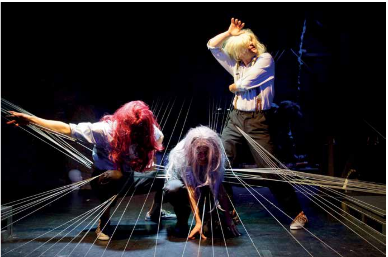
Theaterstück „Beim Barte der Propheten: Haare!“ im Zimmertheater.