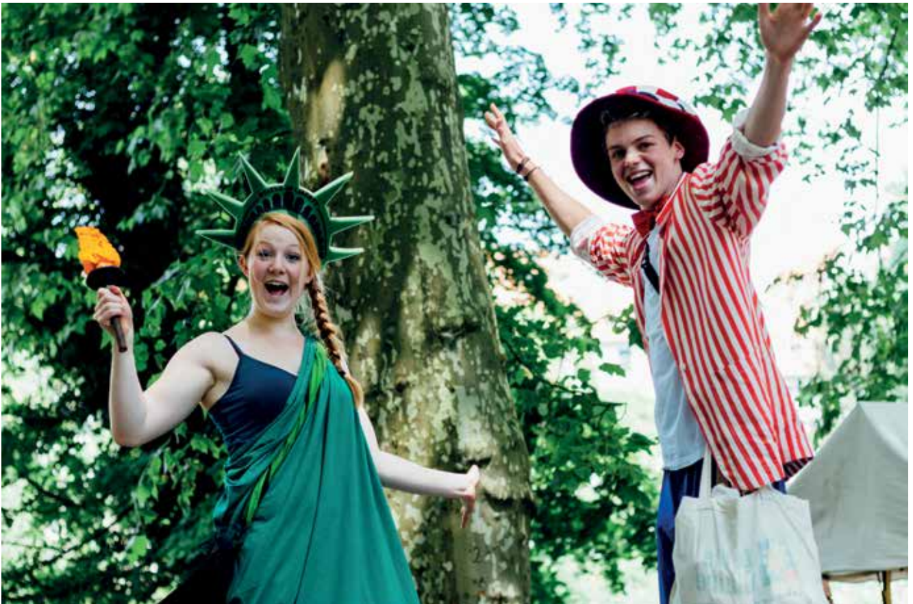
Fest zum 50. Jubiläum der Städtepartnerschaft mit Ann Arbor.

Mit den weltpolitischen Veränderungen der letzten Jahre und den damit zusammenhängenden Entwicklungen zeigte sich aber, dass d.a.i. und ICFA von unverändert großer Bedeutung für Tübingen sind. Grundlegende Änderungen in der amerikanischen Politik, Krisen der EU, hervorgerufen unter anderem durch den Brexit und die Fluchtbewegungen insbesondere des Jahres 2015, aber auch die Erfolge von rechtspopulistischen Parteien in Europa, machen die Institute zu Orten der Vermittlung, des Austausches und des Diskurses, die unabdingbar für die städtische Zivilgesellschaft sind. Werte, die bisher