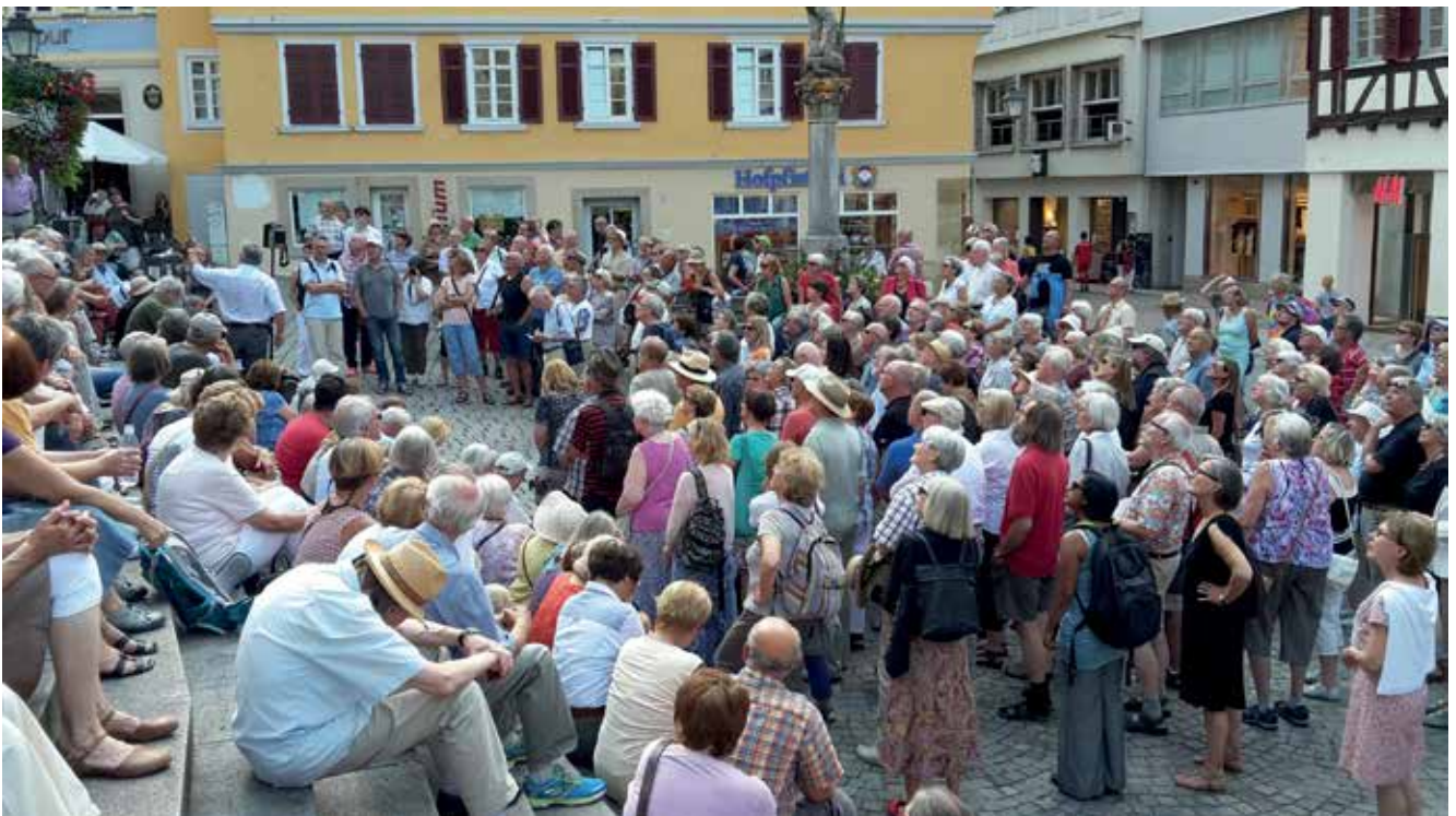
Stadtführung der Reihe „Kennen Sie Tübingen?“, 2016.

Die Konzeption kubit (siehe Schwerpunkt Kulturelle Bildung) hat sich als Gesamtziel gesetzt, die Teilhabeberechtigung für alle Bevölkerungsgruppen zu ermöglichen. Kulturelle Bildung betrifft alle Altersgruppen und steht in direkter Verbindung zu den Themen Inklusion, Integ-