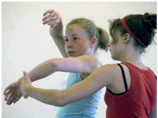
InzTanz – Internationales Zentrum für Tanz.