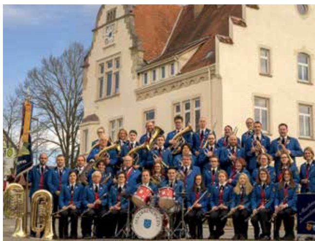
Musikverein Derendingen.

Das Handlungsfeld Brauchtum und Heimatpflege hat einen direkten Bezug zum Thema Kultur vor Ort und in den Ortsteilen. In der Kulturkonzeption, aber auch in der Sozialkonzeption, wurden zum einen die Entwicklung von neuen Stadtteilkonzepten (zum Beispiel im Bereich der Soziokultur) angeregt, zum anderen auch festgehalten, dass der dörfliche Charakter in vielen Tübinger Ortsteilen erhalten werden soll und die Universitätsstadt Tübingen die Vernetzung der einzelnen Ortsteile bezogen auf Initiativen und Vereine unterstützt. Zudem sollen Denkmäler in den Stadt-/Ortsteilen ebenso erhalten werden wie an zentralen Punkten in der Tübinger Altstadt, da die örtli-