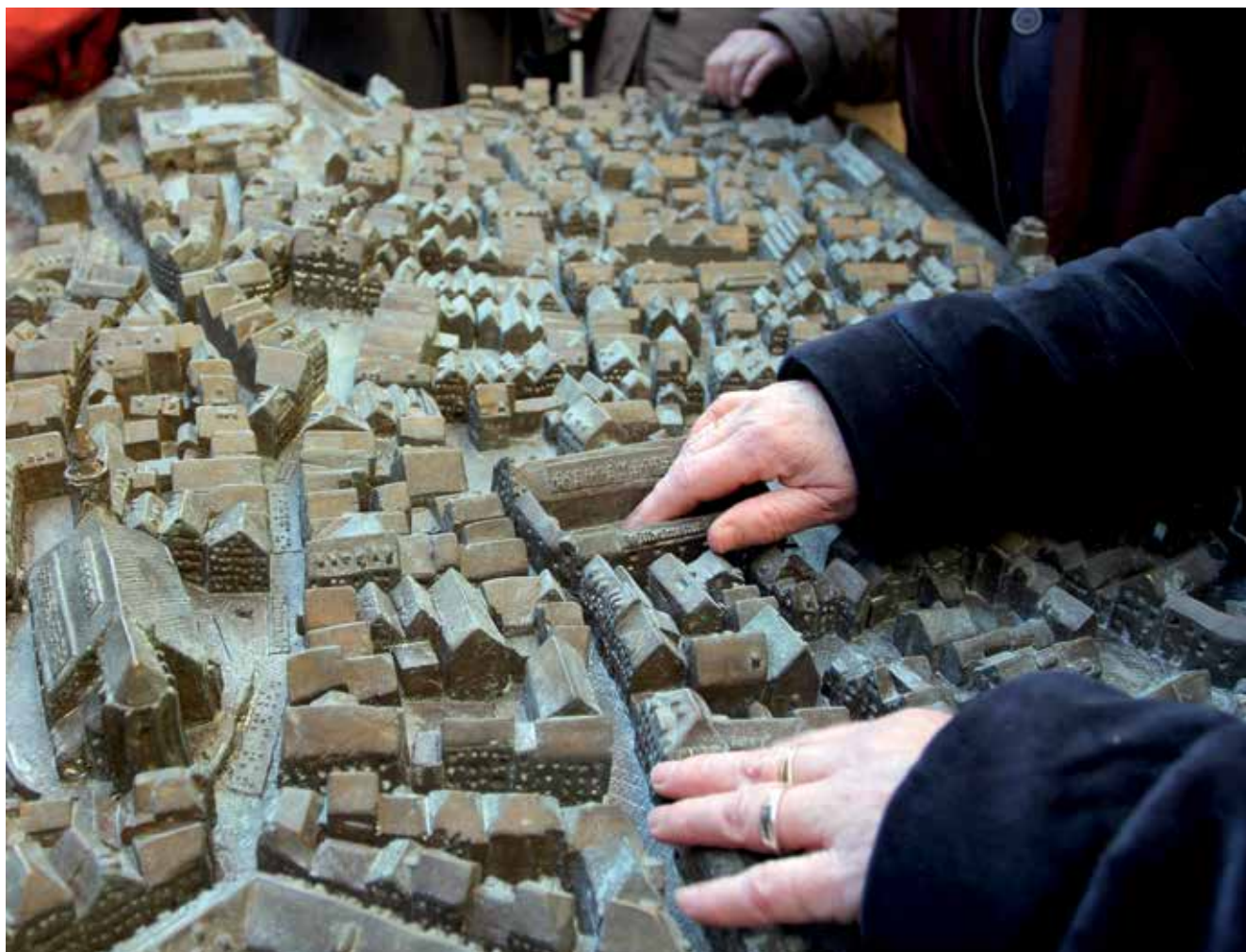
Blindenstadtmodell vor dem Stadtmuseum, gestiftet vom Lions-Club Tübingen.

Die Konzeption 2017 stellt aus Sicht der Verwaltung die wichtigen Handlungsfelder zusammenfassend und an einzelnen Beispielen dar, skizziert Entwicklungen, betont einzelne Aspekte und arbeitet heraus, an welchen Stellen das Konzept von 2012 nachjustiert werden sollte und wo zusätzlicher Handlungsbedarf erkennbar wurde. Die Meinung der Kulturschaffenden und ihre Einschätzung der oben genannten spartenübergreifenden Handlungsfelder wurden in einem Workshop mit über 50 Teilnehmerinnen und Teilnehmern thematisiert, der im Oktober 2017 stattfand. Seine Ergebnisse wurden in die Konzeption aufgenommen.