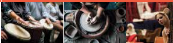
In Leichter Sprache

Förder-Richt-Linien für städtische Zuschüsse im Bereich Kunst und Kultur