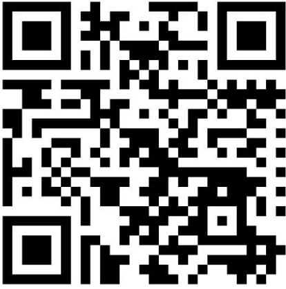
QR-Code zur Umfrage