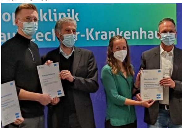
Archivbild: Universitätsstadt Tübingen