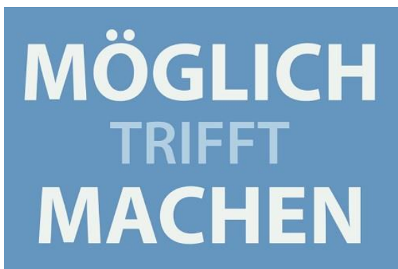
Grafik: WIT/Die Kavallerie