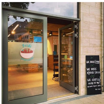
Bild: Fridi unverpackt