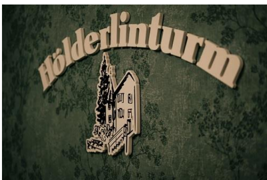
Bild: Restaurant Hölderlinturm