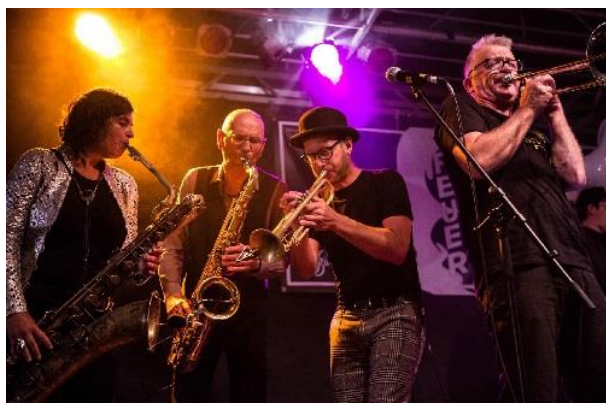
Bild: Louisiana Funky Butts Brassband