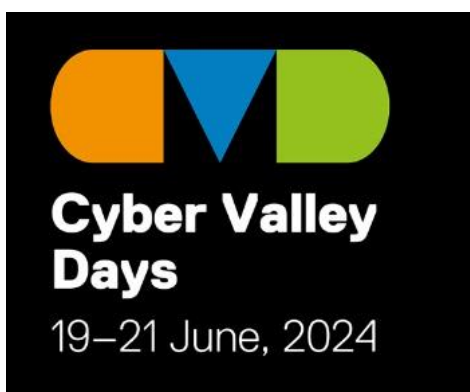
Logo: Cyber Valley Days

Vom 19. bis 21. Juni finden in Tübingen und Stuttgart die Cyber Valley Days statt. Erleben Sie eine außergewöhnliche dreitägige Feier für die Cyber-Valley-Community - einschließlich der feierlichen Eröffnung des ersten ELLIS-Instituts in Tübingen. Die Cyber Valley Days konzentrieren sich ausschließlich auf künstliche Intelligenz (KI), mit einem vielfältigen Programm, das den Schwerpunkt auf Unternehmertum und wissenschaftliche Innovation aus Baden-Württemberg legt. https://cyber-valley.de/de/pages/cyber-valley-days