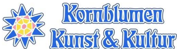
Logo: Kornblumen – Kunst & Kultur