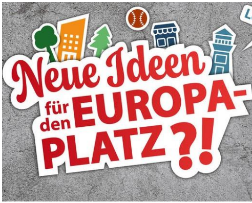
Grafik: Universitätsstadt Tübingen