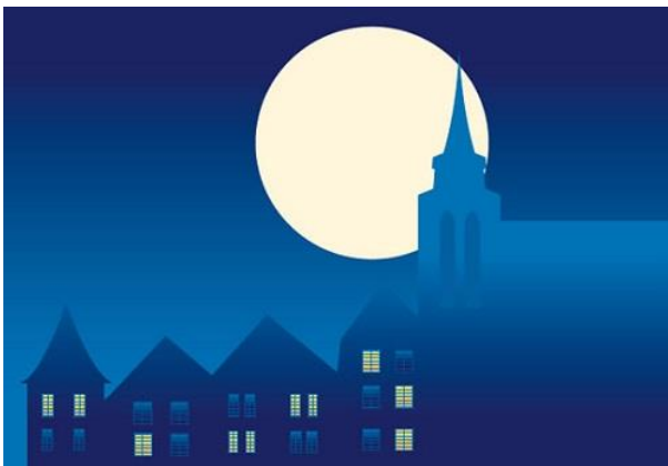
Grafik: WIT / HGV