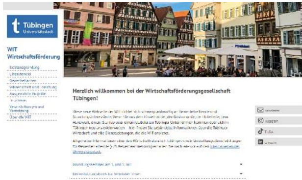
Bild: Vorschau auf die neue Webseite