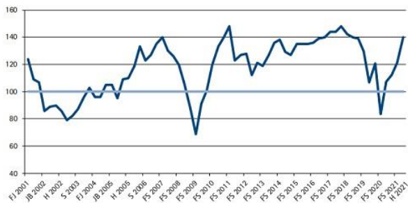
Grafik: IHK Reutlingen

https://www.hwk-reutlingen.de/konjunktur