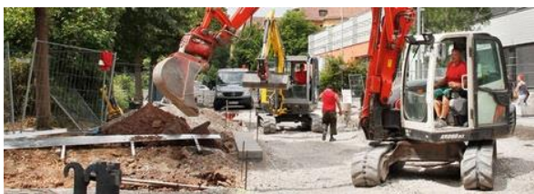
Bildausschnitt: Universitätsstadt Tübingen / A. Faden