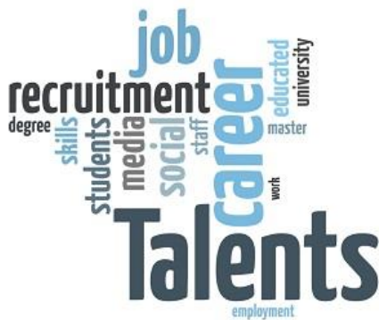
Grafik: Fachtag Personalentwicklung