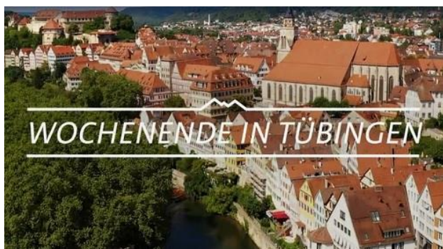
Screenshot: Expedition in die Heimat

Mit der AlbCard erhalten Reisende auf der Schwäbischen Alb freien Eintritt bei über 160 Freizeitangeboten. Neuer Partner der Gästekarte sind seit August die Stadtwerke Tübingen (swt): Übernachtungsgäste in Partnerbetrieben der AlbCard können damit einen kostenlosen Aufenthalt im Tübinger Freibad genießen, das noch bis Sonntag geöffnet ist. Gratis ist unter anderem auch der Eintritt ins Museum der Universität Tübingen (MUT) oder eine Stocherkahnfahrt des Bürger- und Verkehrsvereins (BVV). https://www.schwaebischealb.de/albcard