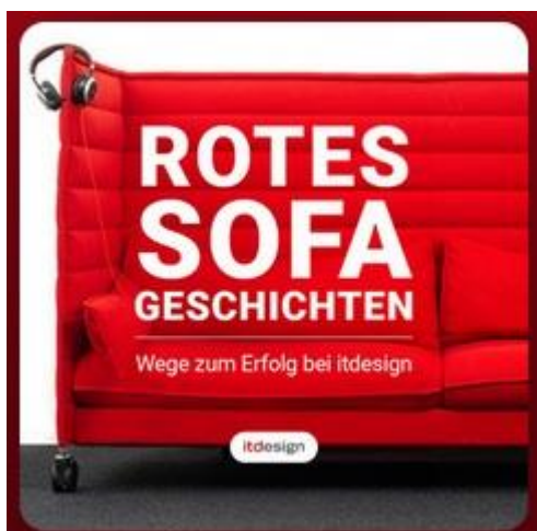
Grafik: it design

Es war die dritte Rezertifizierung und die Bestätigung von zehn Jahren nachhaltig familien- und lebensphasenbewusster Personalpolitik: Die Stadtwerke Tübingen (swt) sind erneut mit dem Zertifikat zum „audit berufundfamilie“ ausgezeichnet worden. In Zeiten des Fachkräftemangels haben die swt damit den Nachweis für eine erfolgreiche strategische Vereinbarkeitspolitik erbracht. https://www.swtue.de/