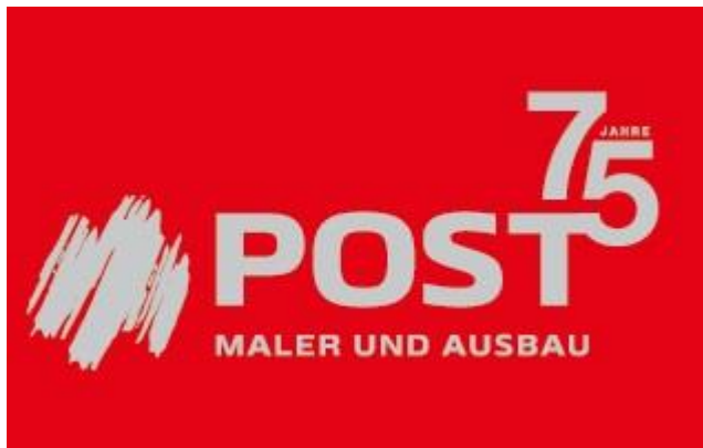
Grafik: Maler Post