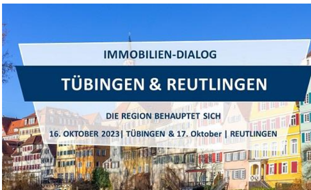
Grafik: Heuer Dialog GmbH

https://www.tuebingen.de/ausnahmegenehmigung