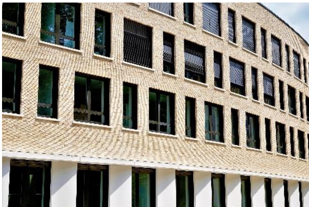
Technisches Rathaus; Bild: Universitätsstadt Tübingen